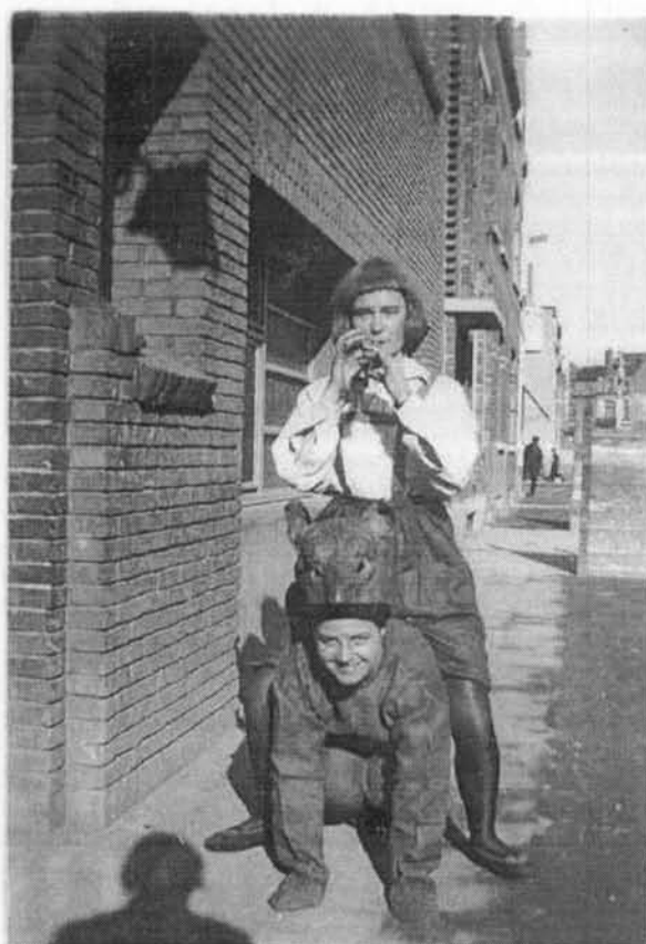
Even ontspannen voor zaal t' Cenakel in Oostende voor de opvoering van 't Wonderlijke wezen in 't woeste wijf' van Ghéon (5 maart 1933)