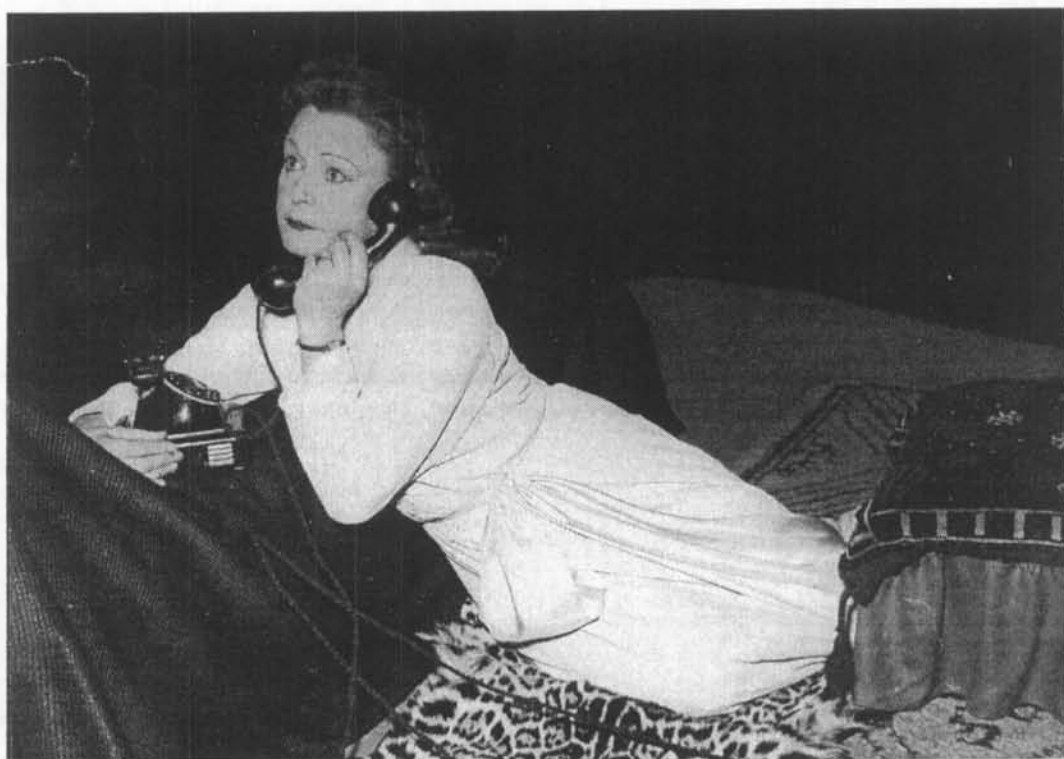
In "De menselijke stem" van Jean Cocteau (KNS Antwerpen, 1953-1954)

De toneelstukken volgen elkaar op. Klassiekers en moderne stukken, drama's en komedies : "Faust", "Mina van Barnheim", "Jeanne d'Arc", "Lady Windermere's waaier", "Driekoningenavond", "Ik dien", "Meisjes in uniform", "Madame Sans-Gêne", "Mevrouw Warren's bedrijf", "Naakt met viool" "De Spaanse hoer", "Lijmen"... Tientallen en nog eens tientallen producties.