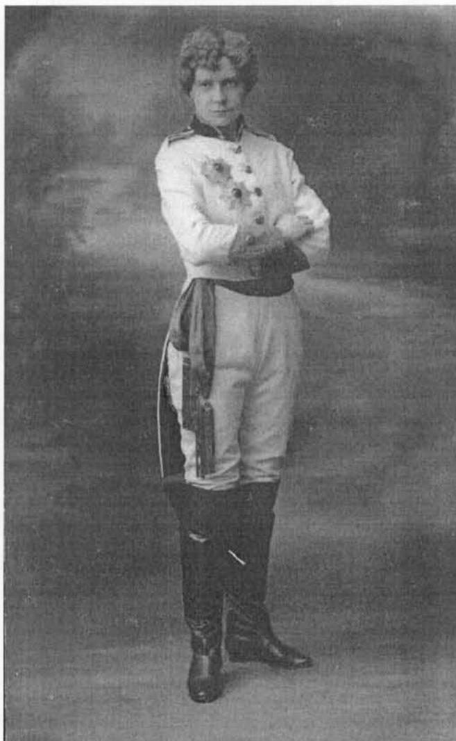
In “l’Aiglon” (1931)

Met het trio Van Thuyne verzorgde Angèle ook een “kunstauditie” in de Witte Zaal van het Oostendse Stadhuis 7 en een auditie in het Kursaal van Oostende 8