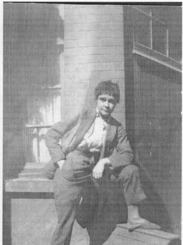
“Poil de Carotte”: 2 x jong en zelfbewust te Oostende (1930)