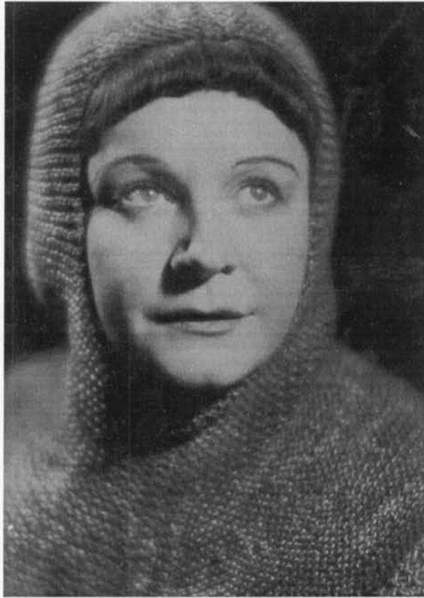
Als "Jeanne d'Arc" in het gelijknamig stuk van Bernard Shaw (KNS Antwerpen, 1938-1939)