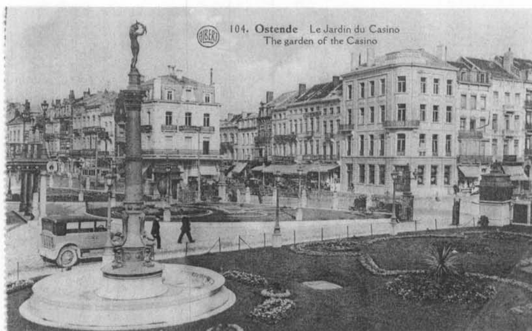
De tuin van het Casino