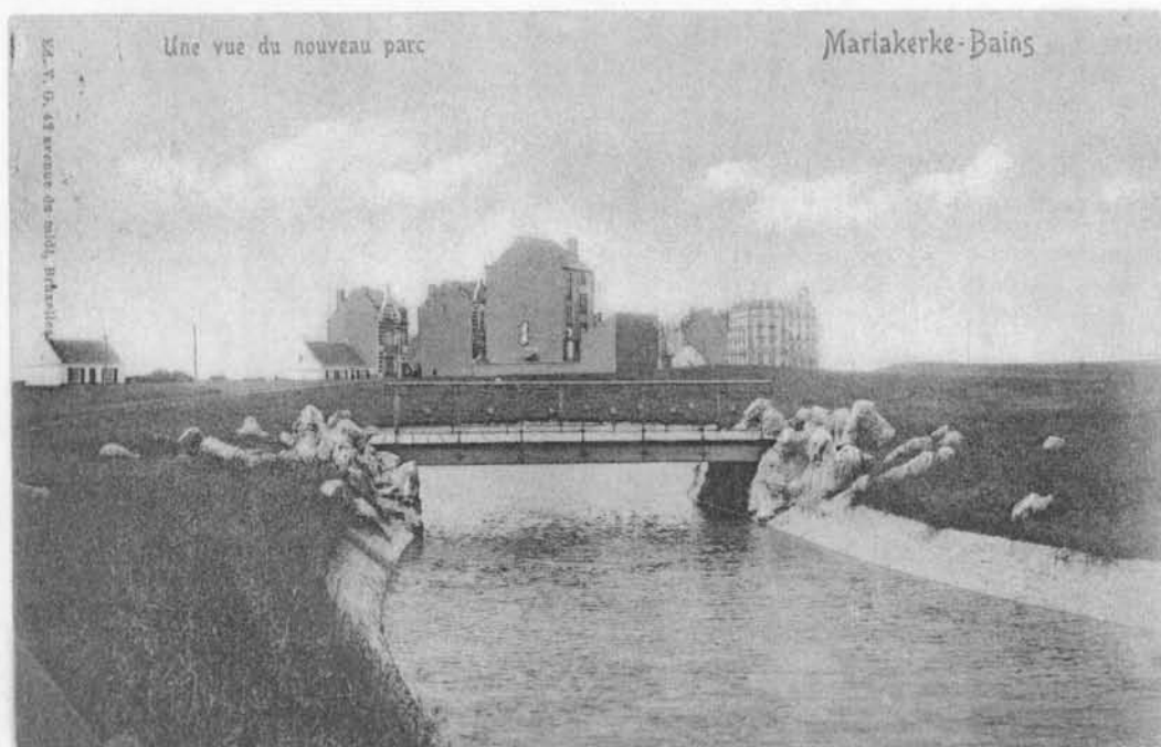
Mariakerke-Bad: zicht op het nieuw park

Komt er ooit nog kentering of wordt Oostende nog méér een bakstenen- en betonnen stad? Wij weten dat we nostalgisch onze bijdrage gemaakt hebben, doch dit komt omdat we steeds van Oostende hebben gehouden en blijven houden.