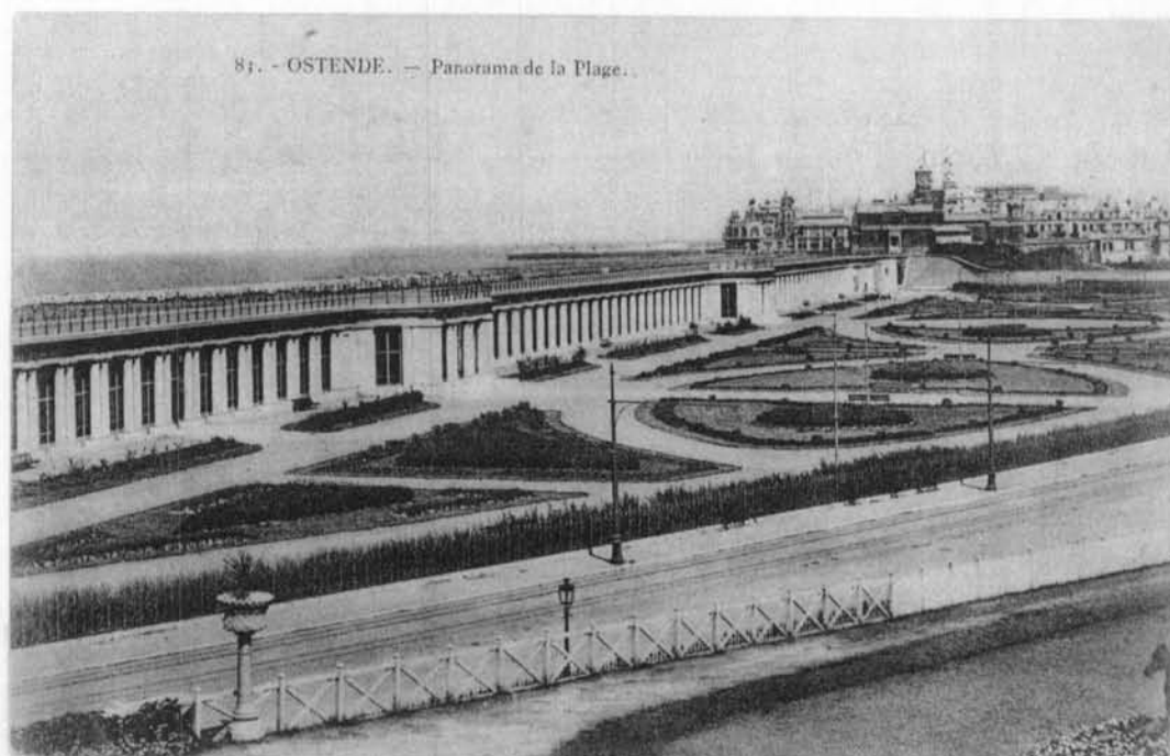
Panorama van het strand