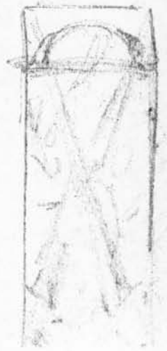
(I) Ontwerptekening grafmonument.