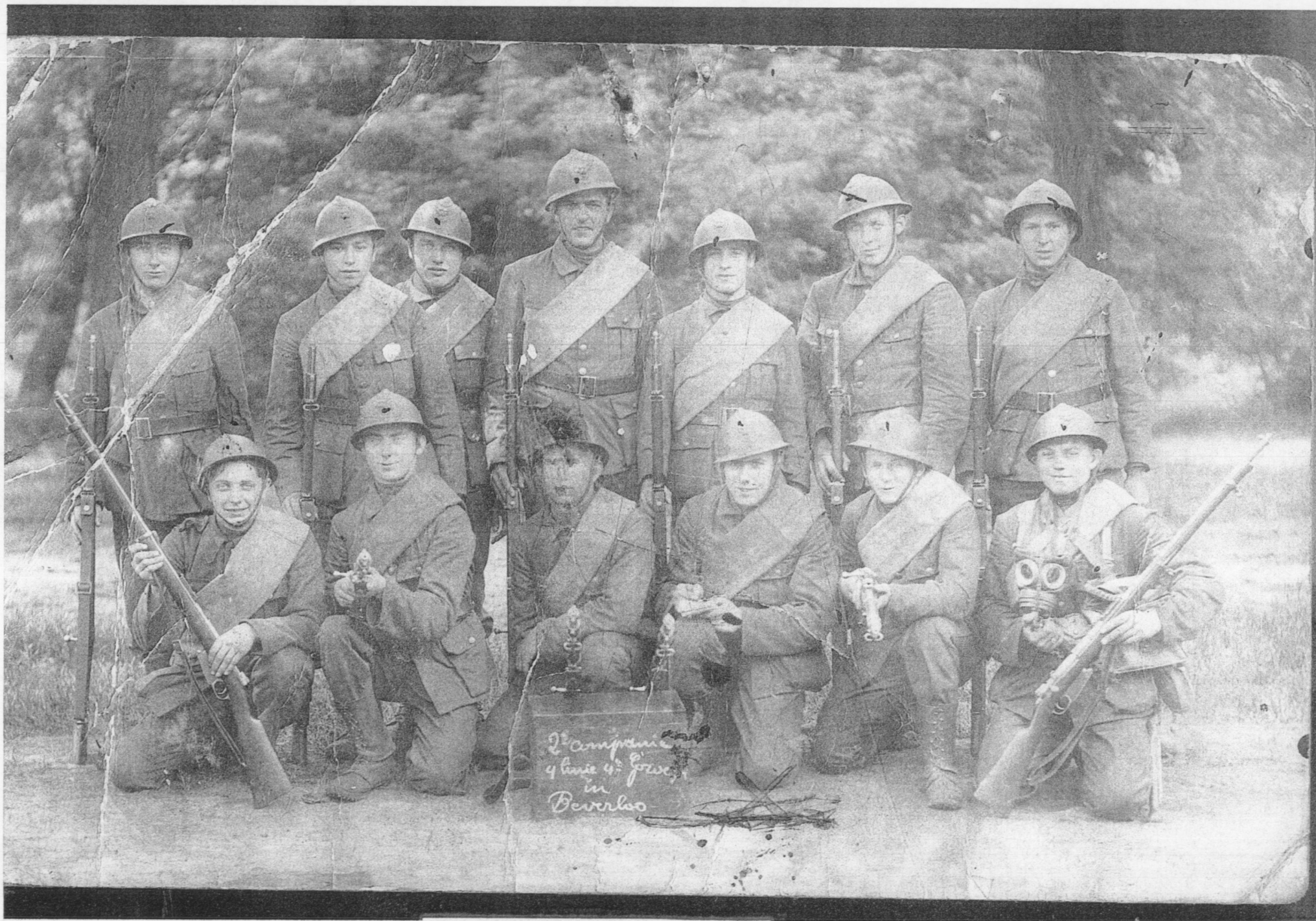
(L) Groepsfoto van de 2 de Compagnie.