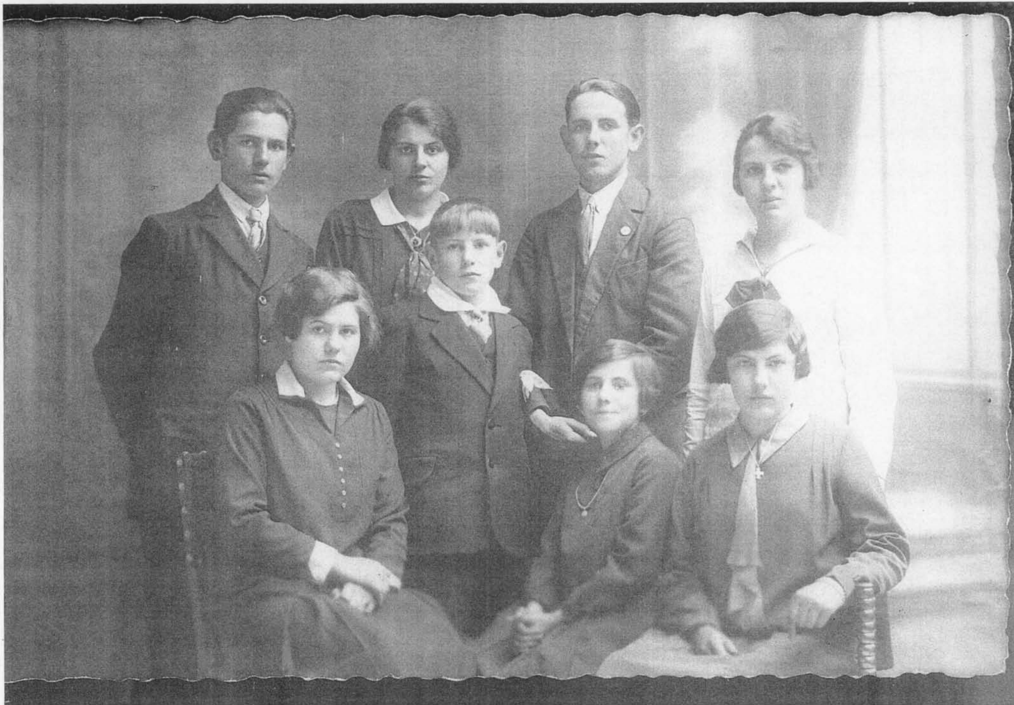
(G) Groepsfoto, de kinderen Schaepdryver.