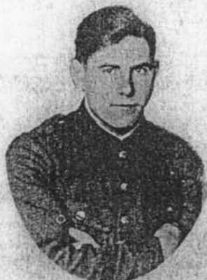
† Tar dierbare Gedachtenis van Mijnheer