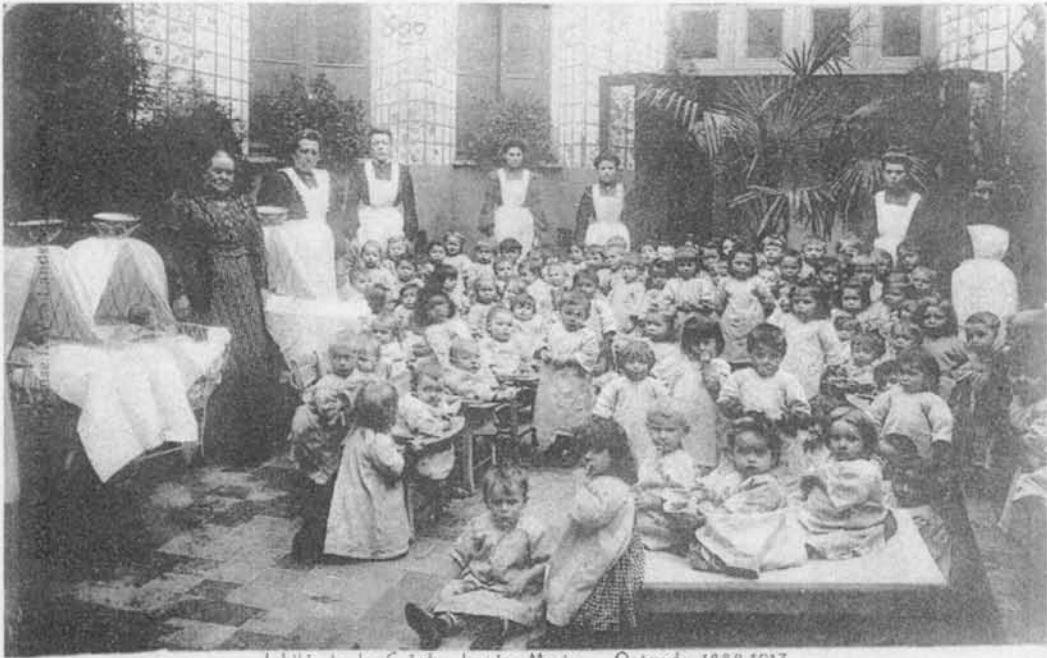
Jubilé de la Crèche Louise-Marie - Ostende 1888-1913.