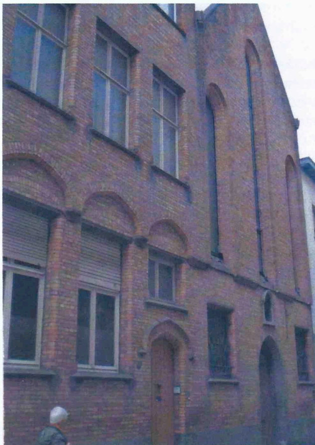
Kapel plus schoolgebouw