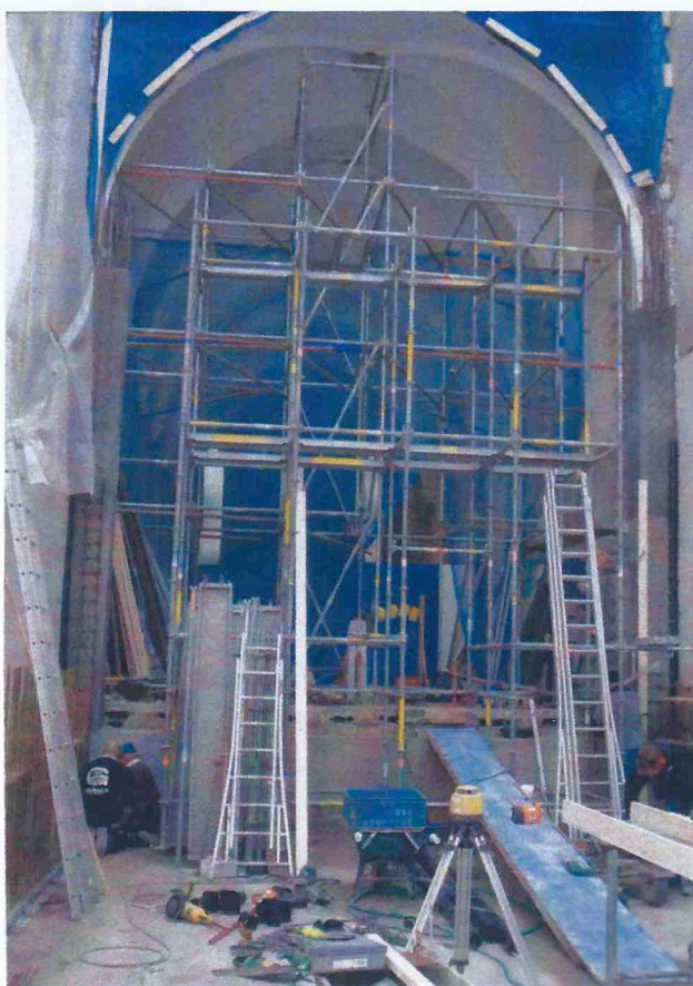
Restauratie kapel, zijde Adolf Buylstraat