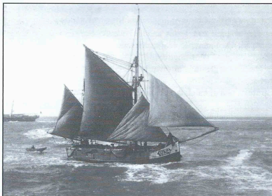
Houten zeilvissersvaartuig O.134 "Naar mijn genoegens". met daarachter een jolletje.

Tot op het einde van de 19 e eeuw werd de visserij uitsluitend met zeilboten uitgeoefend maar vanaf 1890 begon de intrede van stoomtreilers. Dit had voor gevolg dat de vlootstructuur een ware omwenteling onderging: het aantal zeilvaartuigen voor de ‘diepzee’ visserij daalde in Oostende vanaf dan gestaag : van 139 in 1900 naar 63 in 1913. De visserij met zeilboten betekende hoe dan ook hard labeur voor de bemanning : zeilen, vissen en verwerken van de vangst met aan boord amper 5 bemanningsleden.