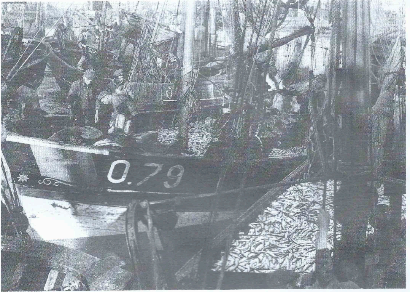
“Haringvangers bij het lossen van hun overvloedige vangsten (1943)