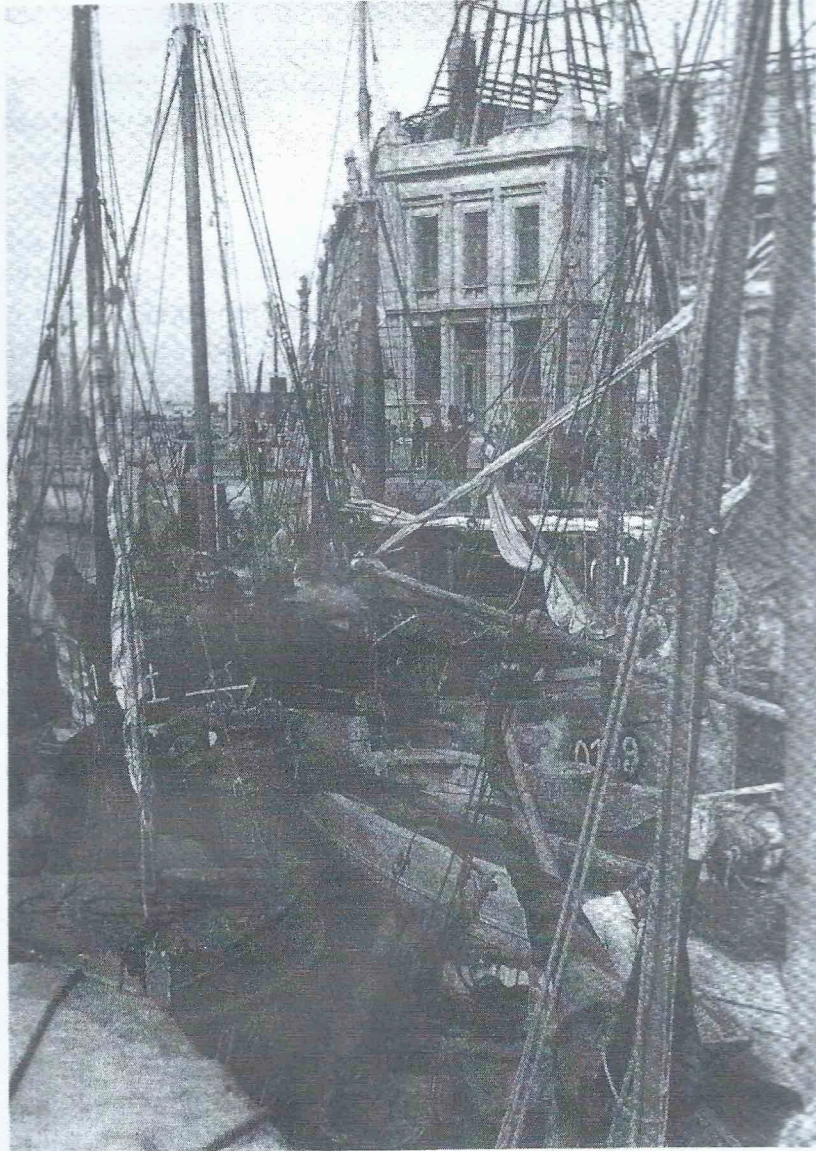
Vissersvaartuigen aangemeerd ter hoogte van het geteisterd stationsgebouw (1943)

ERRATUM i.v.m. de vorige aflevering in deze vervolgserie ("Atlantikwall") : "Meetje van de Kaoie" Blanche Belpaeme werd zwaar gekwetst op 7 mei 1942 (bombardement Sas-Slijkens) en niet op 31 maart 1943 (bombardement wijk Sint-Jan). Met dank aan Rudolf Weise die mij hierop attent heeft gemaakt.