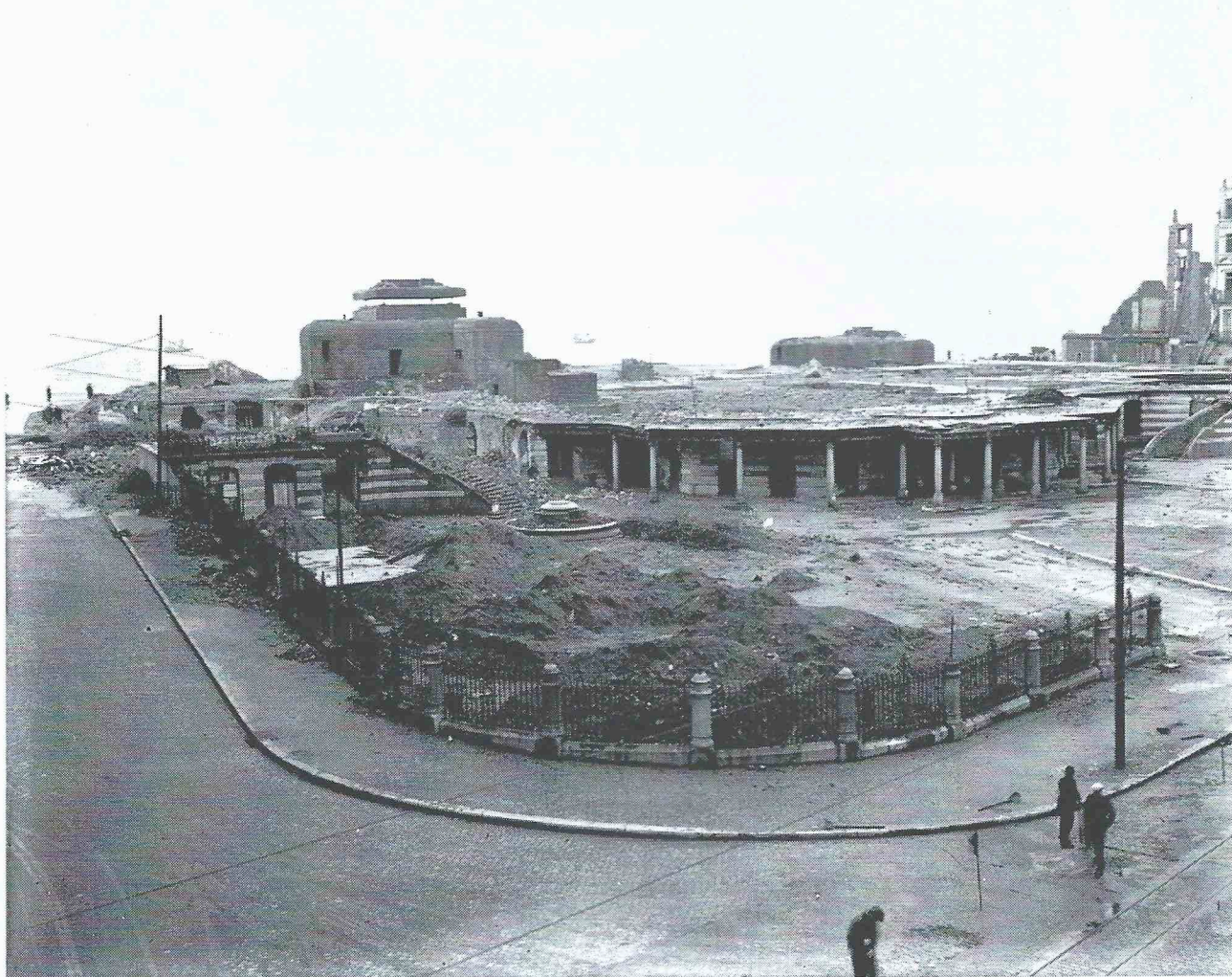
- Na de kaalslag een stuk Atlantikwall op het terrein van het gesloopte Kursaal. (collectie Freddy Hubrechtsen).