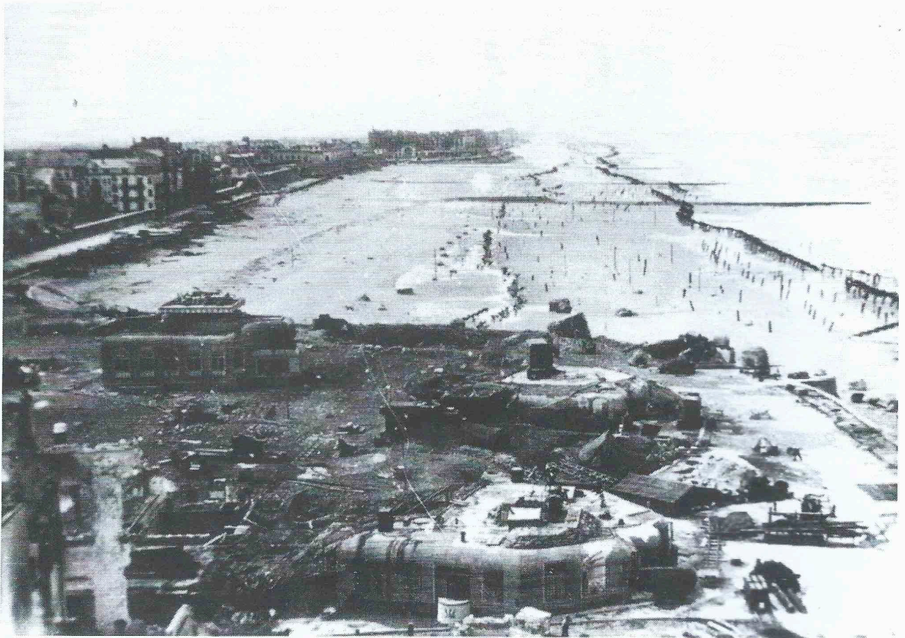
- Strand en zeedijk omgevormd tot Oostendse Atlantikwall. (collectie Freddy Hubrechtsezn).