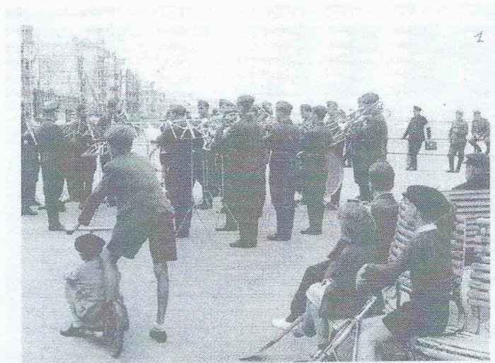
- zomer 1940: “heitere Musik” ter hoogte van Petit Nice (collectie André Asseloos).