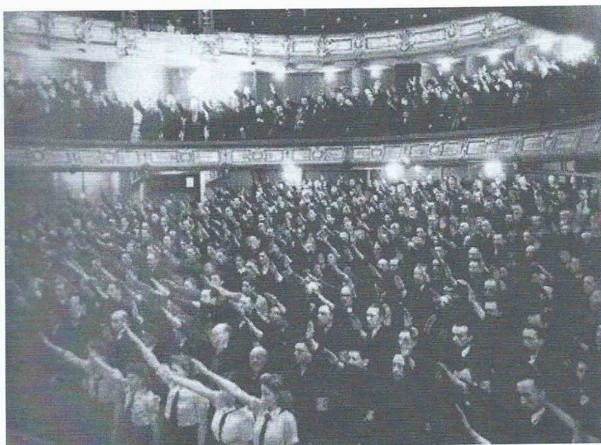
V.N.V.-bijeenkomst in Oostende in de Koninklijke Schouwburg