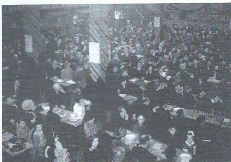
Solidariteitsfeest voor de Oostfronters in het "Schweizerhof" (23.11.1941) (= het gebouw van "Het Witte Paard")