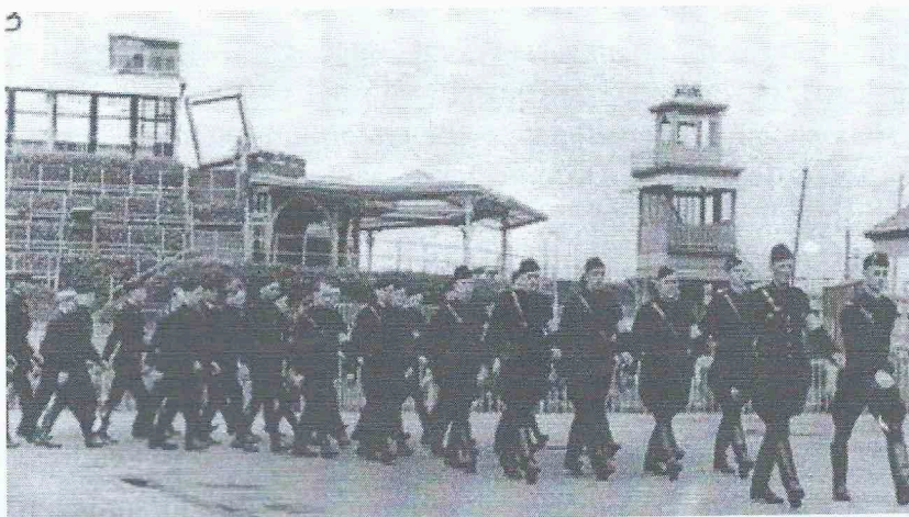
Parade van de "Zwarte Brigade" op de hippodroom Wellington