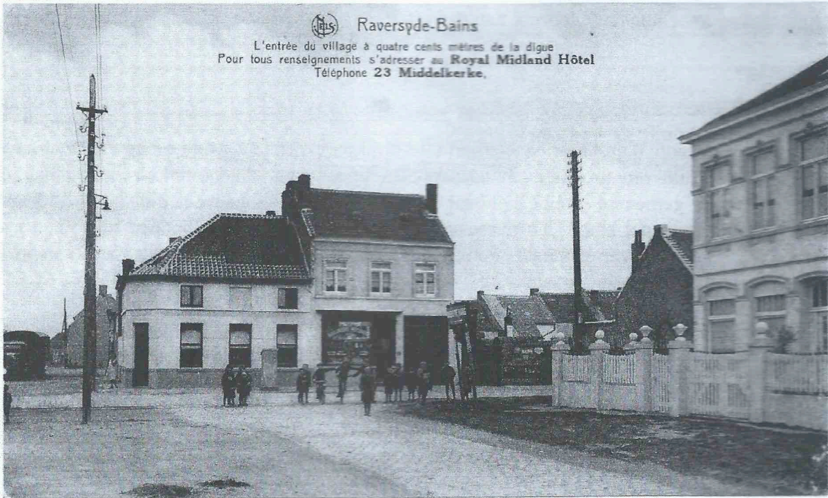
Raversijde rond 1930