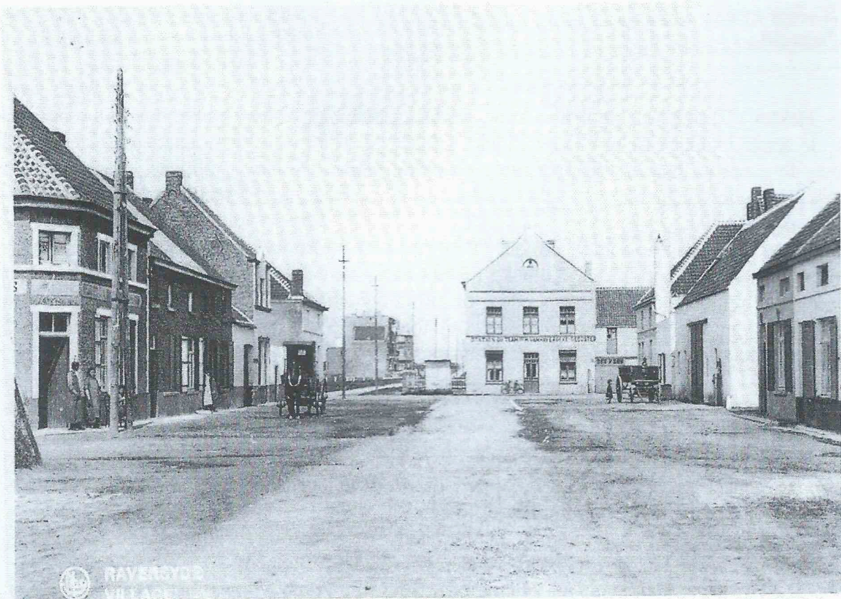
De Schoolstraat. De kaart werd verstuurd op 10 juni 1937.