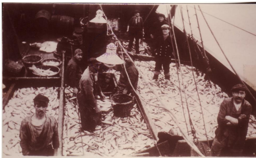
0. 31 John in de Eerste Wereldoorlog

Collectors items, voor verzamelaars een laatste kans!