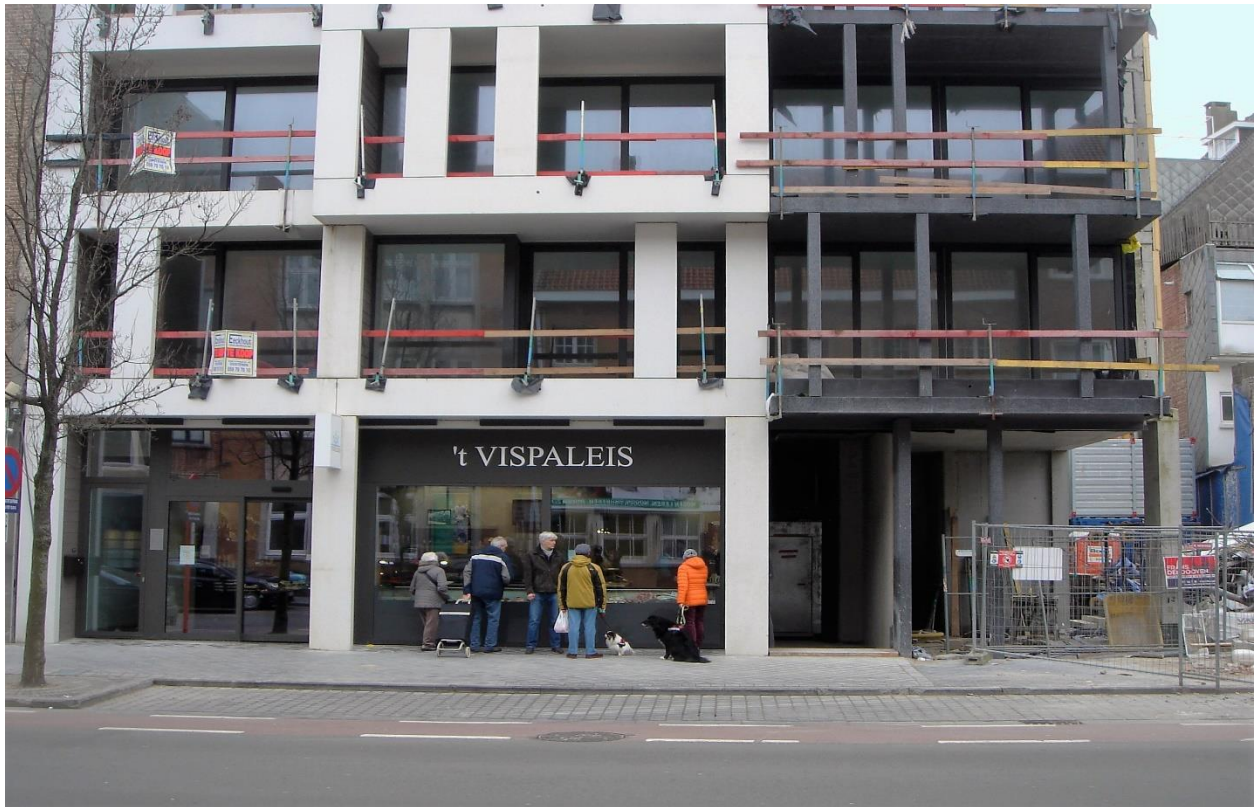
2016 - Alfons Pieterslaan 28