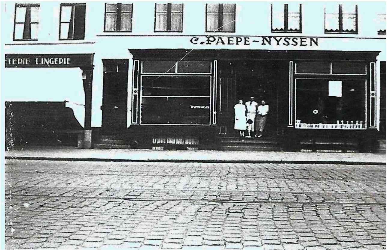
1915 - Alfons Pietereslaan 34-36