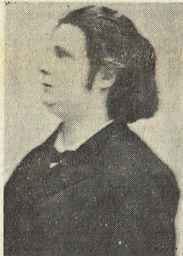
Eugène Isaye was één van de grote virtuozen uit deze tijd. Hij oogstte hier bij prins en mondaine elite enorme bijval.

Eigenlijk liggen we wat overhoop met dat eeuwfeest want dat had al 25 jaar eerder moeten gevierd worden. Het eerste Oostends kursaal werd immers in 1851 opgericht op de oude stadswallen. Het was echter nog een demontabel gebouw dat voor de noodwendigheden van het seizoen kon worden geplaatst of weggenomen. Een bescheiden begin voor een instelling die Oostende's roem en leed zou schrijven in de daaropvolgende decennia.