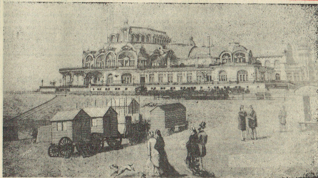
Zo zag het nieuwe kursaalgebouw eruit dat in 1870, na heel wat gemeentelijke strubbelingen, op de huidige plaats werd gebouwd.

zei Koning Leopold II bij de plechtige opening van het nieuw kursaal in 1879