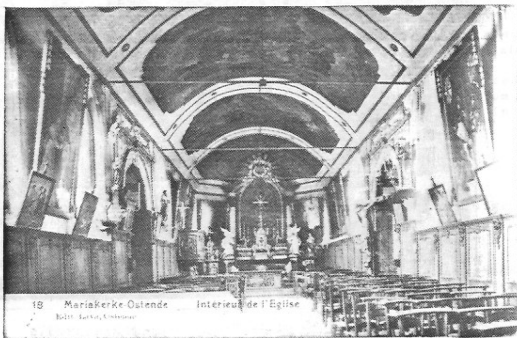
19 Mariakerke-Oostende Intérieur de l'Eglise Eclit. Lacroix, Oostende

Thans hangen in de rechterbeuk (de oude beuk) zeven grote schilderijen verspreid opgehangen tegen de wanden. In de bijgebouwde linkerbeuk hangen drie schilderijen. Ze werden vervaardigd door E. LACROIX uit Oostende en dateren alle uit 1787-88. Ze stellen de vijf blijde en de vijf droevige mysteriën voor. Ook het gewelf was door dezelfde kunstenaar opgesmukt met schilderijen. Deze stelden de vijf glorieuze mysteriën voor.