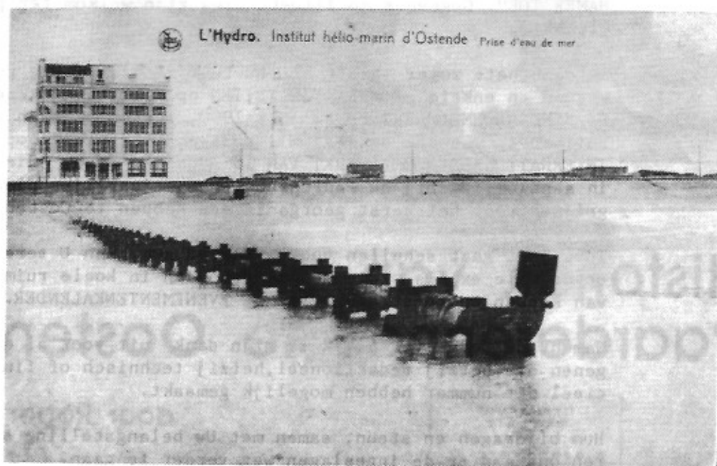
Prise d'eau de mer. (N.E.L.S.)