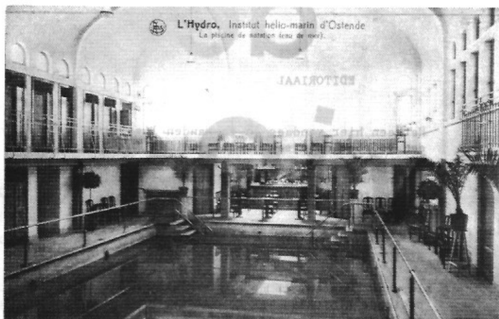
L'Hydro, Institut hélio-marin d'Ostende (N.E.L.S.) La piscine de natation (eau de mer)