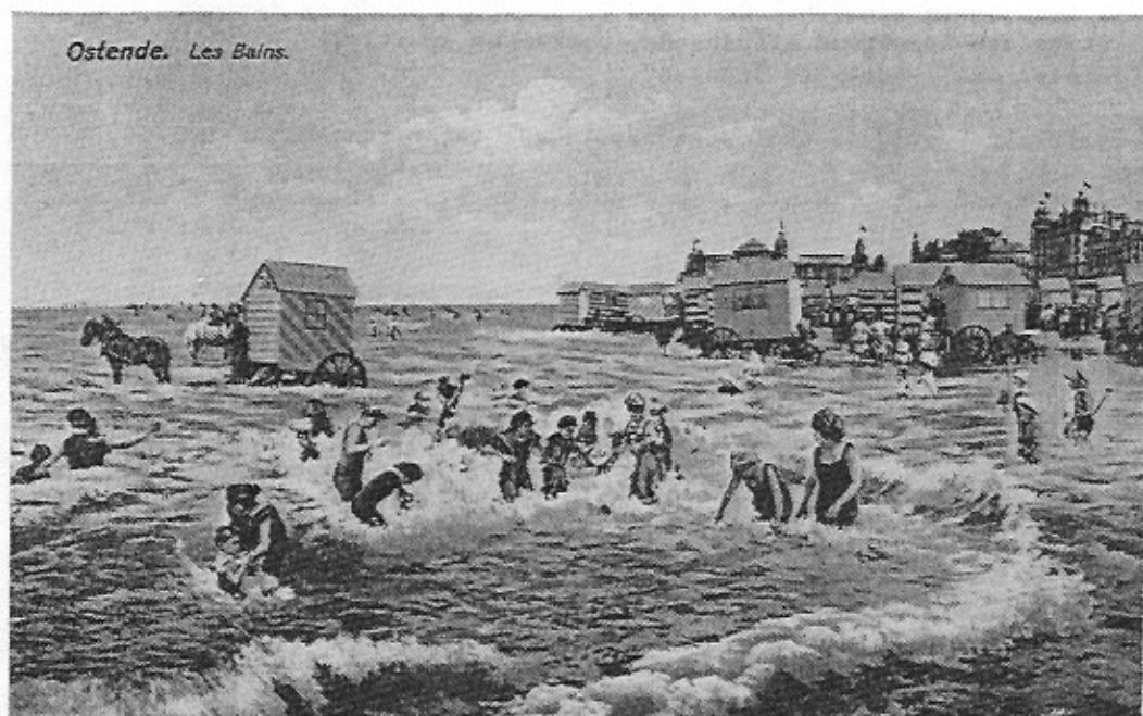
Aan het strand van Oostende : tussen de badkarren, door paarden in zee getrokken, dartelen de badgasten (Ed. Le Bon, 1906).

In deze eerste bijdrage wordt gehandeld over het inschakelen van dieren in deze kustfolklore.