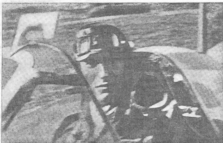
Commandant René Mouchotte, gefotografeerd op 27 aug. 1943, twintig minuten vóór zijn daad.

Deze Franse piloot zou later, nl. op 27 aug. 1943 boven zee worden neergeschoten door Duitse Fackelwulf jachtvliegtuigen tijdens een escortevlucht van Amerikaanse vliegende vestingen op een bos nabij St. Omer, waar een vijandelijke tankeenheid was gesignaleerd.