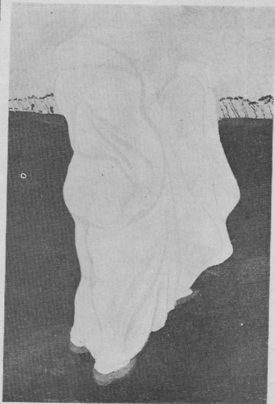
Leo Spilliaert. — Witte gewaden (1912); Muzeüm voor Schone Kunsten, Oostende.

Wat er ook van zij, het soepele penseel, het ruige papier, de onvervalste, eerlijke, matte tonen van waterverf of gouache pasten wonderwel om zijn verfijnde en vergeestelijkte droomwereld uit te beelden, en in de aanwending deze karinge midde'len is Spilliaert een meester gebleken. Het zintuiglijk schilderen, met borstel en olieverf, de