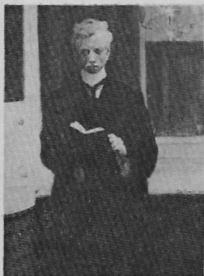
Leo Spilliaert. — Zelfportret (1907), waterverf op papier, 49 x 36 cm; Muzeüm voor Schone Kunsten, Antwerpen. Kl. V.T.B.

gemakkelijke retouches, het overschilderen, dit alles bleef hem vreemd. Wij kennen slechts een tiental olieverfschilderijen van hem, en het lijkt wel of deze materie te « materialistisch » was voor zijn verfijnde geest, te kleverig voor zijn lichte maar durvende hand, die niets aan het toeval overliet. Hij wist op wonderlijke wijze met kleuren om te gaan, met « zijn » kleuren. Soms beperkte hij zich tot de vloeiende gamma's van één kleur, waarmee hij een sterk plastisch resultaat wist te bereiken. Hij had een fijn ontwikkeld gevoel voor kleurenritme. Hij verstond de kunst het vlammeendste geel en het diepste blauw, het tederste roze, naast elkaar te leggen, zonder dat zij elkaar neutralizeerden of zonder dat het evenwicht van het geheel gebroken werd. Hij kon meesterlijk gebruik maken van witte partijen, soms verfloze, die hij zodanig wist te isoleren dat zij tot volwaardige pikturale elementen uitgroeiden. Niet alleen de lijn maar ook de kleur, hoe weinig schitterend zij ook was, laadde hij met een expressieve kracht.