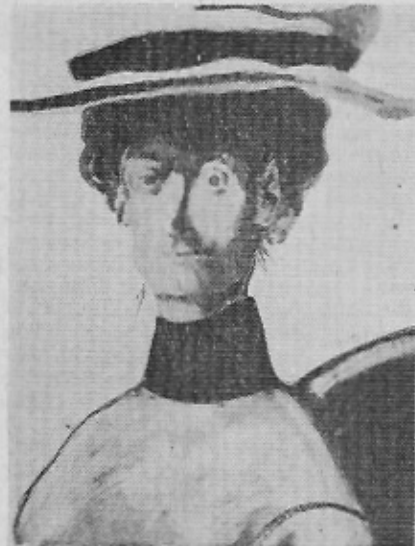
Leo Spilliaert. — De roze hoed (1904), Muzeüm voor Schone Kunsten, Oostende.

waarin hij de obsessie van de stilte schiep, Spilliaert koos hiervoor, enkele jaren vroeger, de vluchtende, geometrische lijnen van een verlaten zeedijk, uitlopend op de schrale silhoeët van een wenkende vuurtoren, de eindeloze galerijen met hun ontelbare zuilen, een verregend strand, met nog één zielig, achtergebleven tentje.