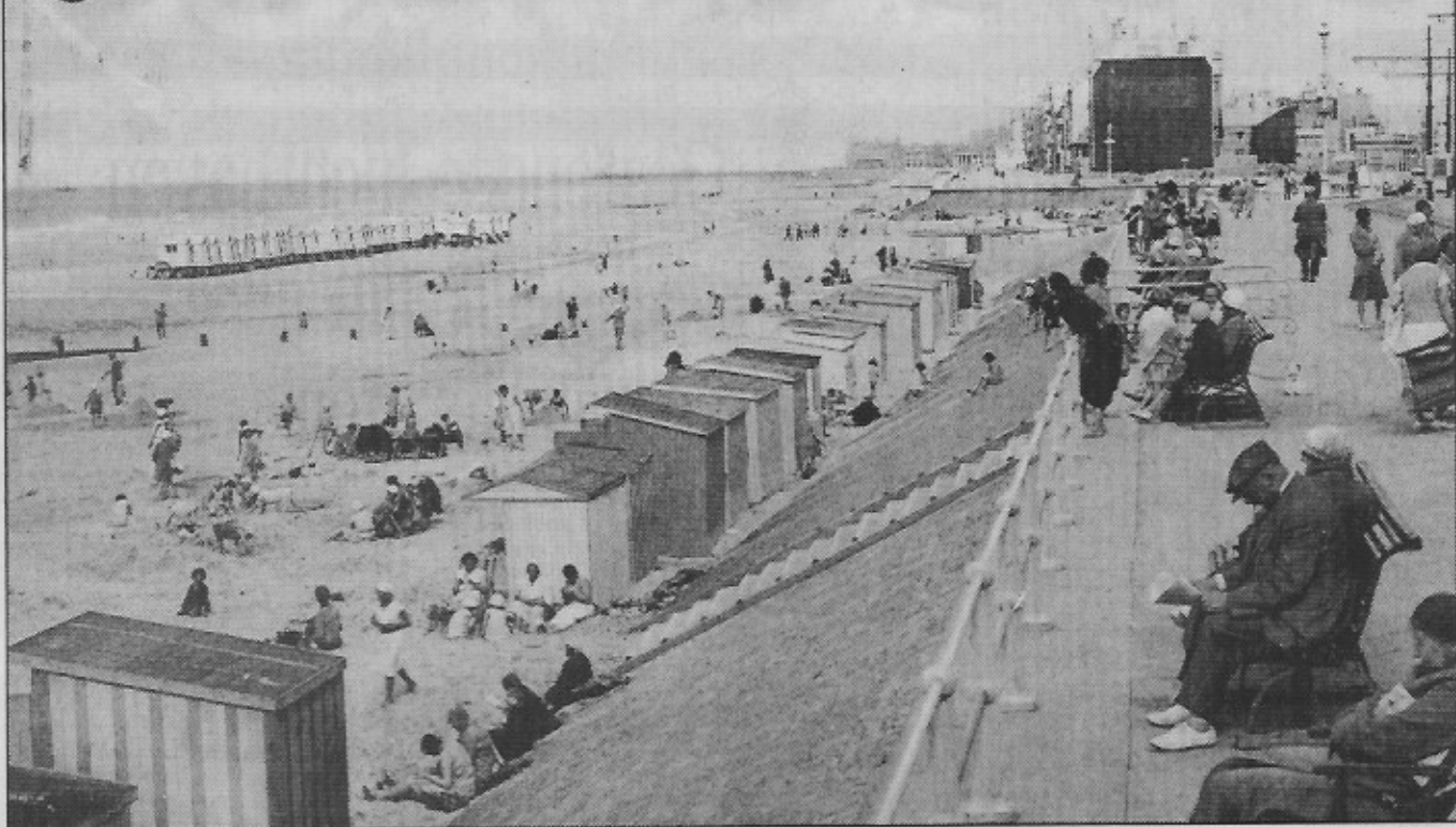
De zeedijkbanken in Mariakerke. (Circa 1930)

52. Mariakerke Baden Algemeen zicht Bains Vue générale