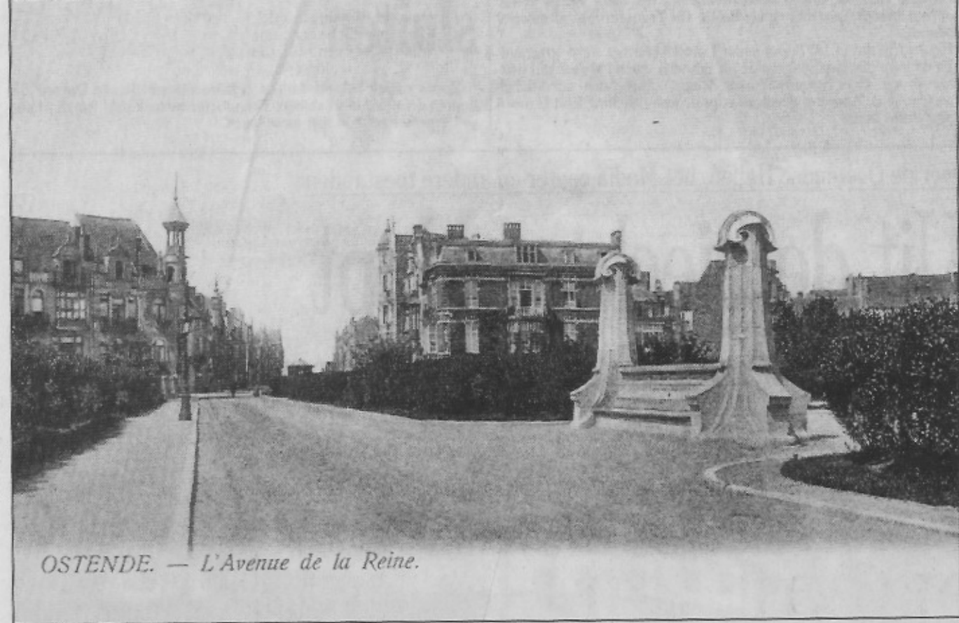
OSTENDE. — L'Avenue de la Reine.

De Stenen Bank in de Koninginnelaan als enig Jugendstil-monument in Oostende. (1905)