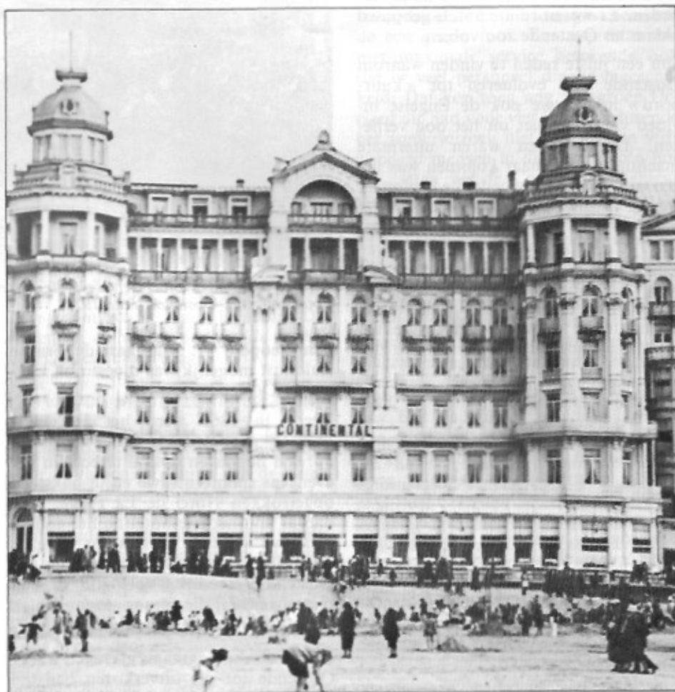
Het Continental Palace dat vele Oostendenaars zich nog zullen herinneren. In de zomer kwam men er kijken naar de dames in hun chique toiletten en de heren in zwart habijt.

Wat gebleven is, dat is de zon, de zee en de wind die de frisse gezonde zeelucht