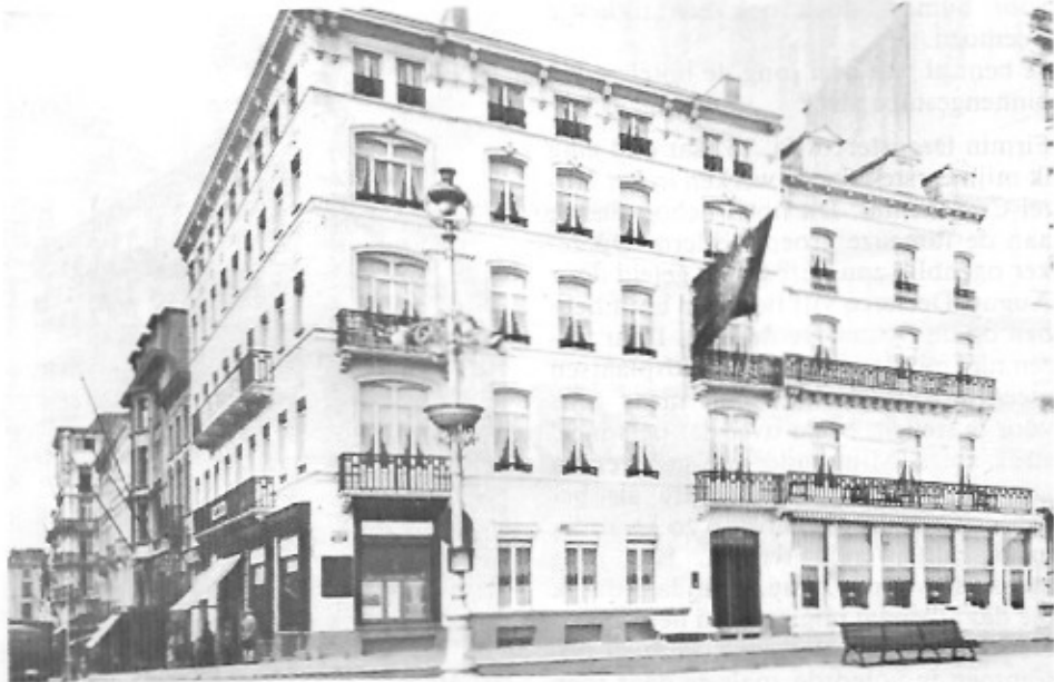
Kursaal en Beau Site, waar nu de tearoom Beau Site gevestigd is. Ooit was ook dit een hotel dat toebehoorde aan de groep Declercq en Cie. Het was wel het kleinste hotel van de groep. Al telde het toch nog 150 bedden.

Naast de adel kwamen de grootste handelaars en nijveraars naar Oostende... de rijke dames en heren die zich graag lieten bekijken door (het volk). Naar Oostende kwamen toen ook de luxe vrouwen van plezier zoals Cléo de Mérode, la Belle Hélène. Heel chique dames waren dat. Steevast omringd door heren in zwart habijt die het als een bijzondere eer beschouwden met hen te mogen dineren... een glas champagne te heffen op hun schoonheid.