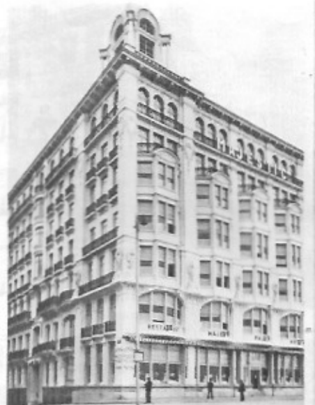
Het Majestic Palace gelegen aan de Louisaramp op de Albert I Wandeling. Er waren 250 kamer waarvan 80 met bad.