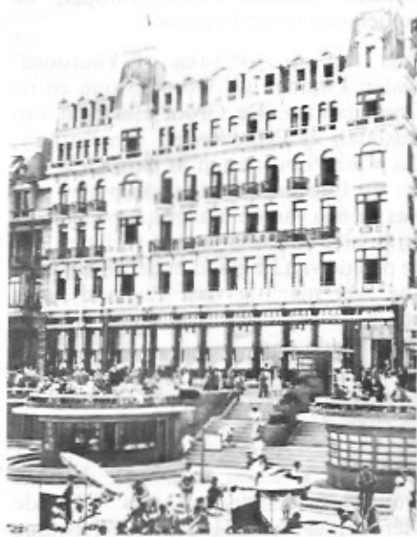
Het Splendid Hotel, daar werkten tijdens het seizoen niet minder dan 155 mensen. Het restaurant was toen een gastronomische top-per. Het zaalpersoneel was haast uitsluitend Italiaans.