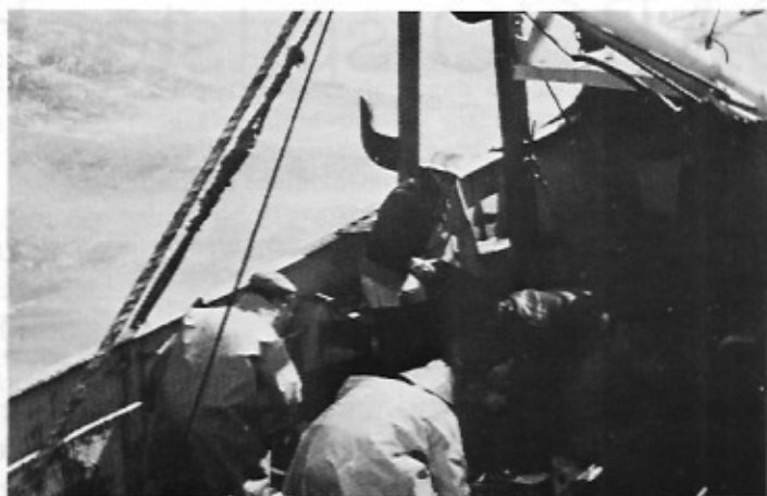
De vis wordt gesorteerd, krabben, zeesterren en het klein grut gaan terug in zee.

tussen Frankrijk, een tipje België en England - ; later op de Noordzee - hogerop, naast Denemarken en Noorwegen. « Ik heb ook op IJsland gevaren... », vertelt hij en denkt, «...nu varen er vanuit Oostende maar vier boten meer op IJsland! ». Hij staart vanop de brug, die kleine stuurhut, recht voor zich uit, door een openstaand pletsnat venster-tje. En zwijgt.