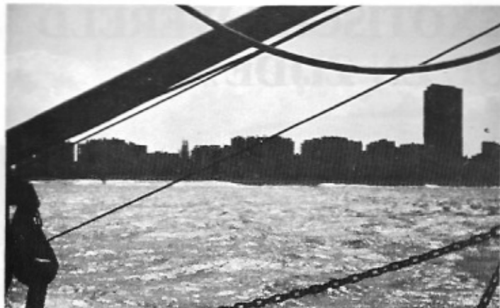
Een mooi zicht op Oostende vanaf de O.29 de Broodwiner. Voor ons een mooi plaatje, voor hen dagelijkse kost.

De O.29 is beslist geen gewoon vissersvaartuig. Een andere bemanning is zevenkoppig. Hier zijn er vier, die elk alles kunnen. Anderen varen om den brode. Geen vis, geen eten of geen geld. De O.29 hoeft niks te vangen. Ze mag niet commercieel vissen. Bedoeling blijft de jonge vissers de zee te le-