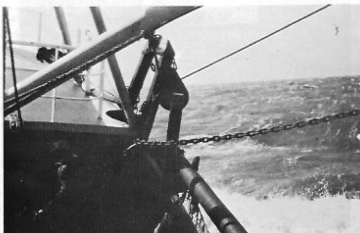
Het weer verslechtert nog, zeevang '4 tot 5 en een wind tot 7 beaufort uit het noordoosten nog wel.

Sinds 1945 vaart hij, de schipper. Eerst op het kanaal - wat dan staat voor de zee