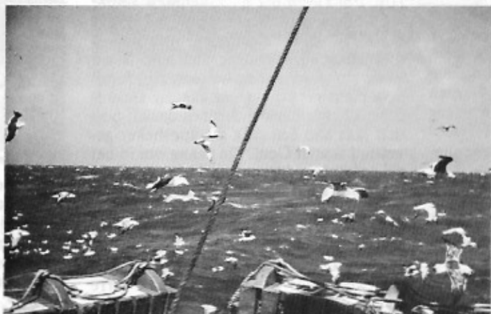
Zilver- en mantelmeeuwen azen op buit wanneer de netten worden binnengehaald.