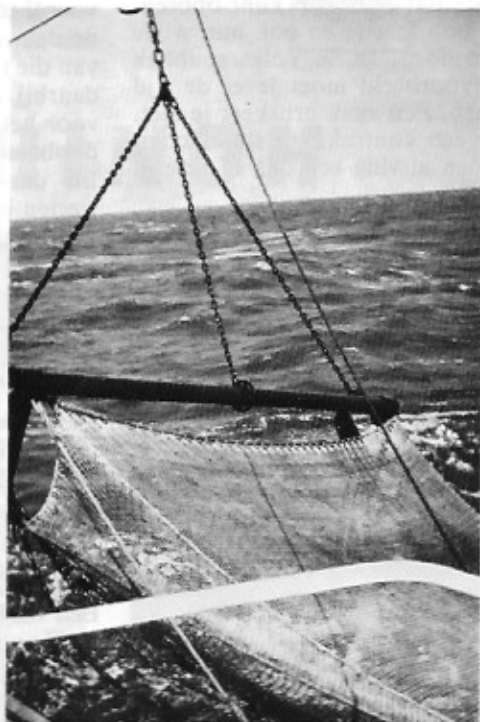
De bokken worden uitgezet.