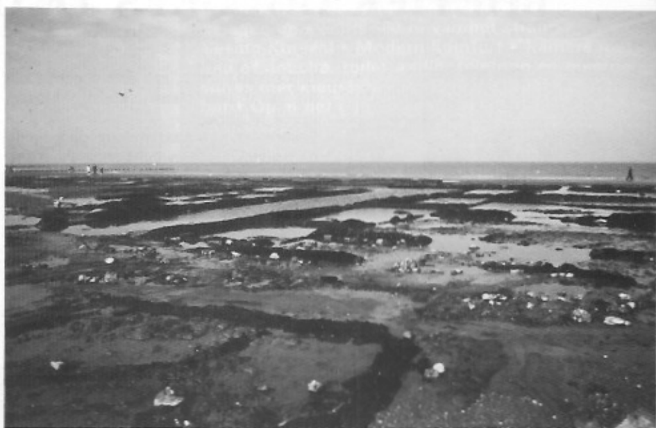
De veenderij op het strand van Raversijde.

Hun werk is des te belangrijker al we weten dat de vindplaats inmiddels onder een nieuwe laag zand bedolven zijn geraakt