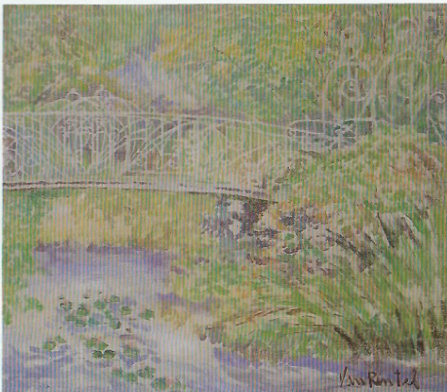
Brug met bloemen.

Je moet het inderdaad maar doen, zo'n verroest hekkentje zo'n kracht meegeven in een schilderij.