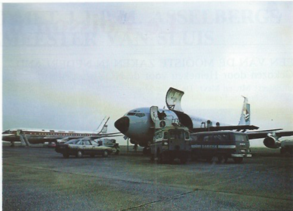
Een dagelijkse drukte waar men in Oostende geen weet van heeft.