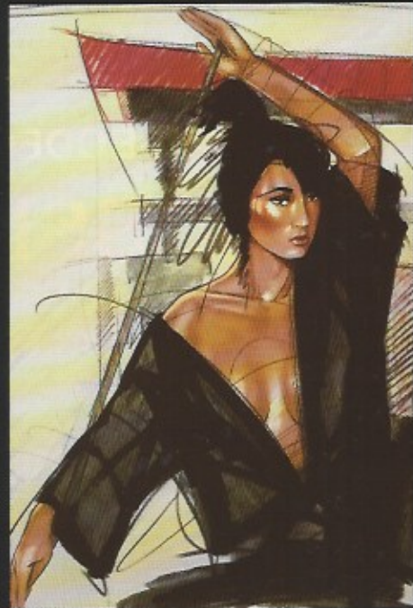
Japanese Temple by Nico.

Vrielinck doet dit op eigentijdse wijze, origineel, gewaagd maar vooral doodeerlijk.