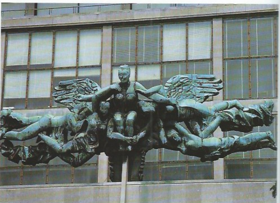
Met de beeldengroep van Jozef Cantré is het Postgebouw een geklasseerd monument.

tistisch monumentale facetten die we aantreffen in zijn postgebouw te Oostende. De plannen voor het postgebouw werden pas op 24 juni 1947 goedgekeurd. Het postgebouw werd pas in de loop van 1953 in gebruik genomen. De indrukwekkende beeldengroep van de beeldhouwer, tevens vriend van architect Jozef Cantré (1890-1957) werden pas in 1963 aan het gebouw toegevoegd.