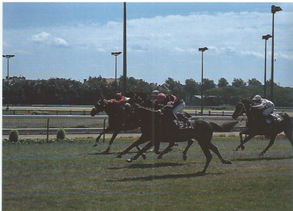
De renbaan van Oostende is zonder twijfel de mooiste hippodroom van ons land. Het prachtige restaurant, een gezellig terras en tal van andere akkomodaties maken dat iedereen er zijn gading kan vinden.

Dit hele gebouwencomplex is bijzonder interessant. In wezen sluit Eysselincks gebouw aan bij het negentiende-eeuwse warenhuistype, waar de trappen naast een functie van verbinding van de verschillende verkoopsverdiepingen binnen het ruimteconcept ook de visuele betrokken-