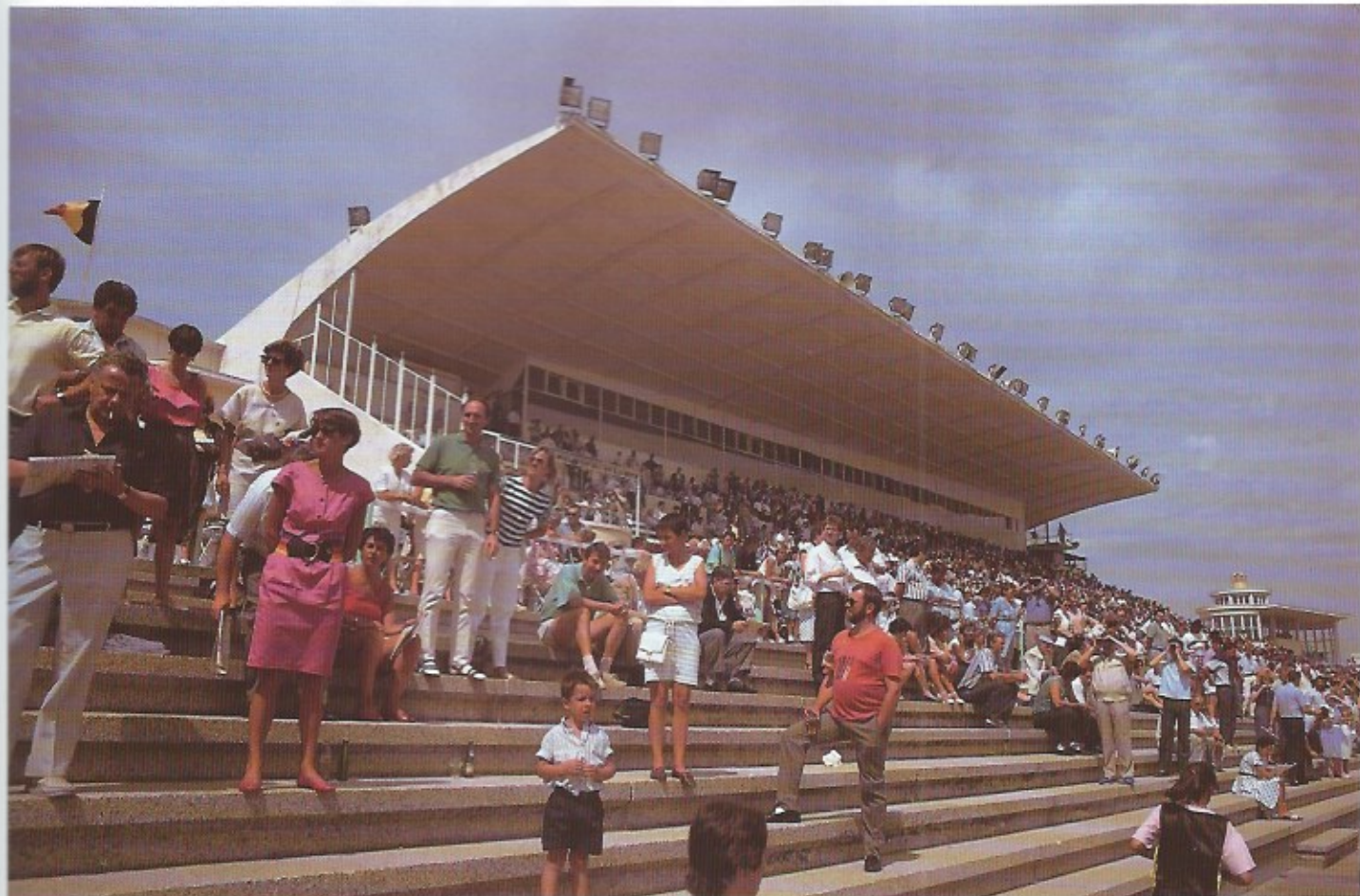
Een zowel qua architectuur als qua functie zeer belangrijk gebouw in Oostende is zonder enige twijfel de tribune van de Wellington-renbaan.

Oostende is zonder twijfel de 'tribune' van de Wellington Hippodroom of zoals ze in Oostende zeggen 'den paardekoers'. Samen met het kursaal is het één van de laatste getuigenissen in deze stad van mondaine voornaamheid