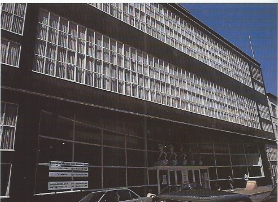
Het zeer functionele Provinciaal Museum voor Moderne Kunst.

heid tussen klant en koopwaar stimuleren.