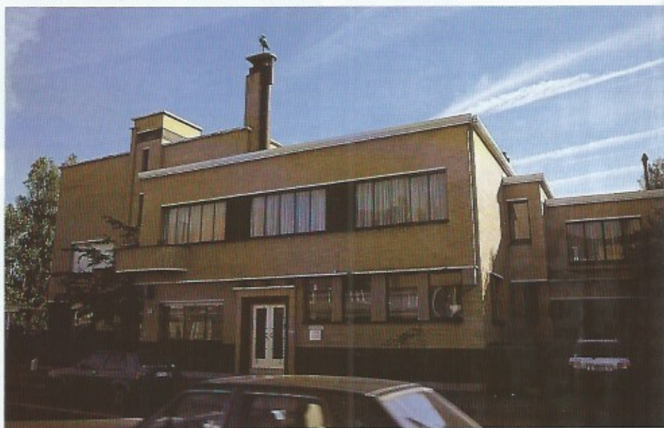
Voorzijde 1 van de woning