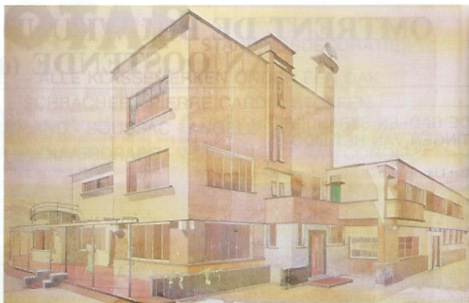
Ontwerp woning DEPUYDT door architect DE BRUYCKER.

Overigens trokken architect De Bruycker en bouwheer dokter Depuydt samen op studiereis naar Hilversum (Nederland) om er de ontwerpen en de ideeën van de