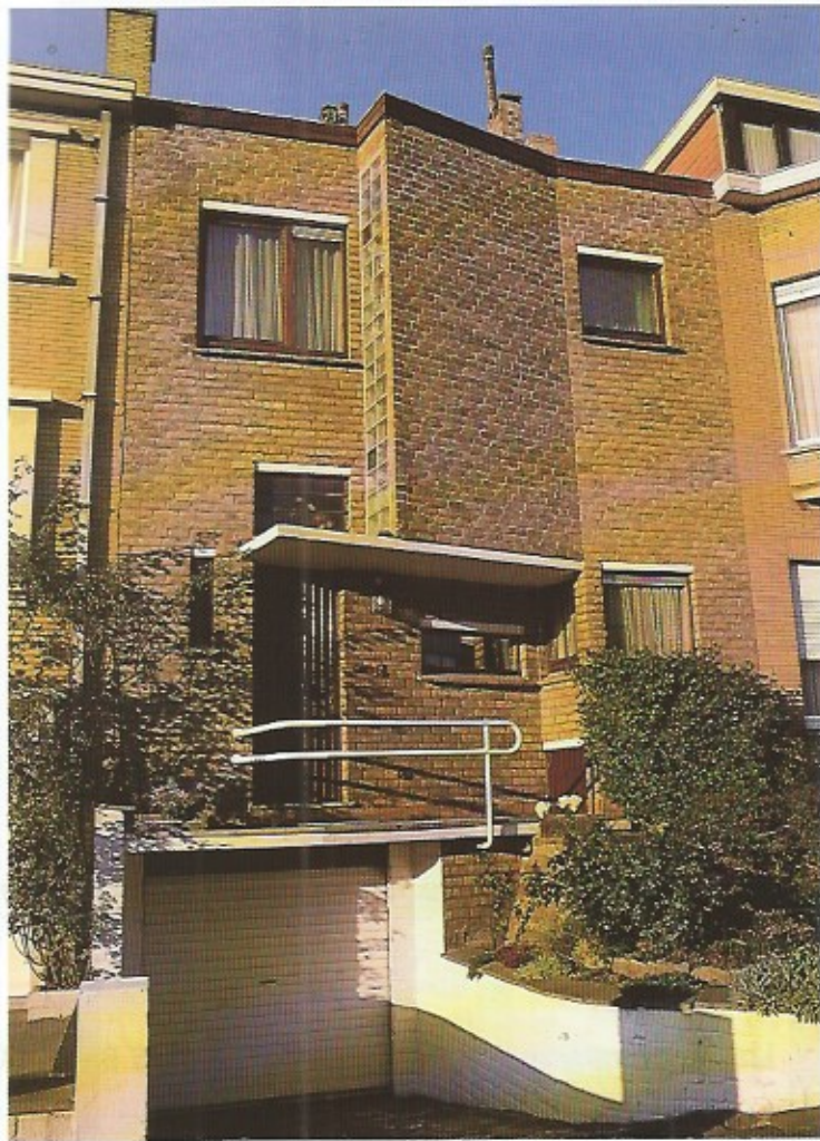
Deze woning gelegen in de Acacialaan nummer 6 is een eenvoudig maar belangwekkend stukje Oostends erfgoed.