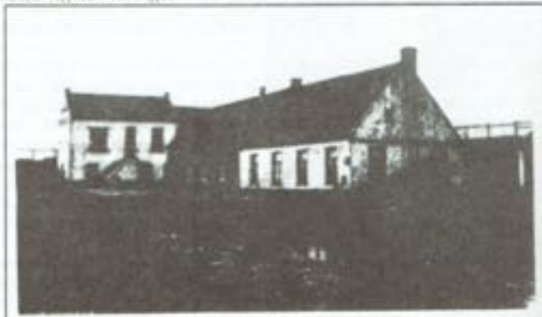
Het eerste maritiem station te Oostende in 1842

Builer 35/50/30 Rapport over wetenschappelijke