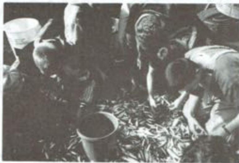
Sprotjes uitzoeken aan boord van de O 29 door Ibis-leerlingen

Andere jaren wanneer de visjes niet zo talrijk en soms van mindere kwaliteit waren moesten ze gezeefd worden. Het gebeurde vaak dat er zo'n 6000 kilo per dag gezeefde