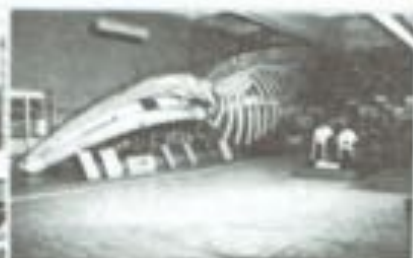
Aquarium et Musée de Zoologie