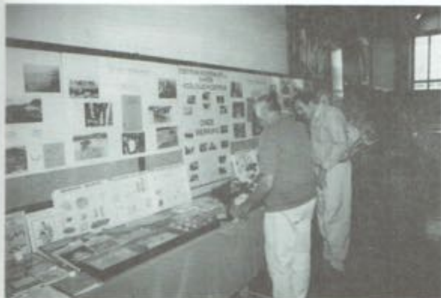
Stand van het Marien-Ecologisch Centrum