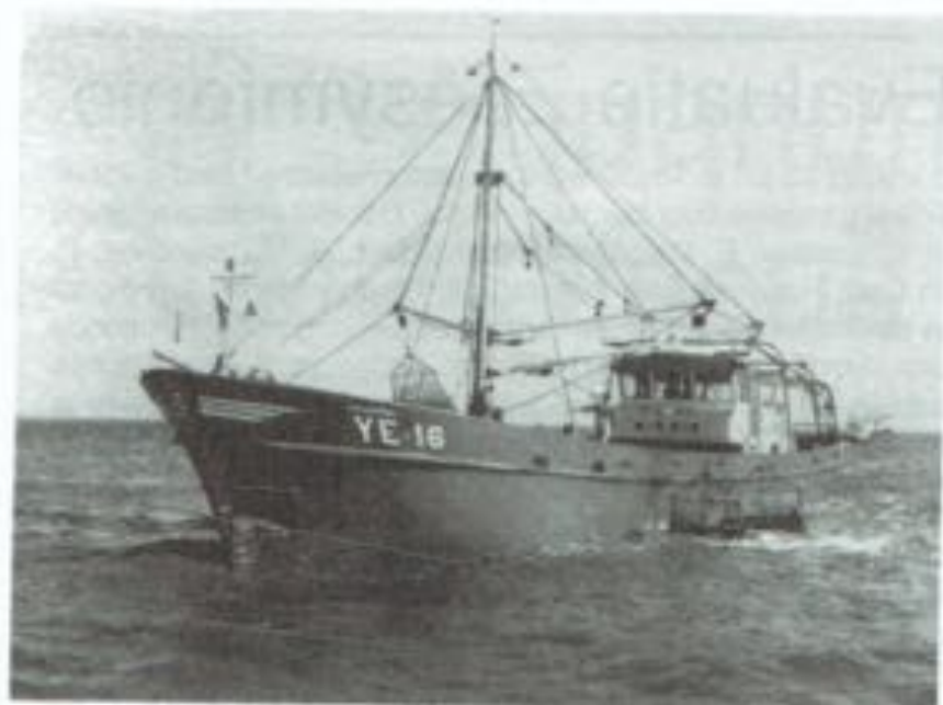
Mosselzadvissersrij met e YE 16 'Johanna'

meter water staan, maar bij laag water moeten de mosselen droog vallen. De mossels worden er bij hoog water uitgestort en het dun over de bodem leggen geschiedt dan bij laag water. Dit is noodzakelijk om een absoluut zandvrij produkt te krijgen. Na één tot twee weken vist men de mosselen en gaan ze de wal op. Hoewel hun groei onder natuurlijke omstandigheden plaats heeft kan ook bij mosselen van een cultuurbedrijf worden gesproken, omdat de kweker steeds op de meest geschikte tijdstippen ingrijpt. Hij vist het mosselzaad opom het op percelen uit te zaaien. Tot halfwas opgegroeid wordt het wederom opgevist en naar een ander perceel overgebracht om daar de marktwaardige kwaliteit te bereiken. Dan wachten nog de verwaterplaats, het sorteren, wassen en de verzending. In het walbedrijf worden de mosselen gezuiverd; in mosselmolens worden de te kleine exemplaren en ledige schelpen verwijderd. Voort worden de mosselen gewassen en op de lopende band tenslotte worden zij van de laatste ongerechtigheden ontdaan. De verzending van verse mosselen geschiedt in balen. Een belangrijke hoeveelheid wordt door de inleggerijen verwerkt tot de bekende gemarineerde mosselen. Nederland is met zijn 90 tot 100 miljoen kg per jaar de grootste mosselproducent ter wereld. Van deze jaarlijkse Hollandse mosselberg gaat er circa 42 % naar België. Frankrijk neemt er 16% van, de inleggerijen 27% terwijl Nederland zelf er maar 14% van neemt. Dus de Belgen zijn de grootste mosseleeters.