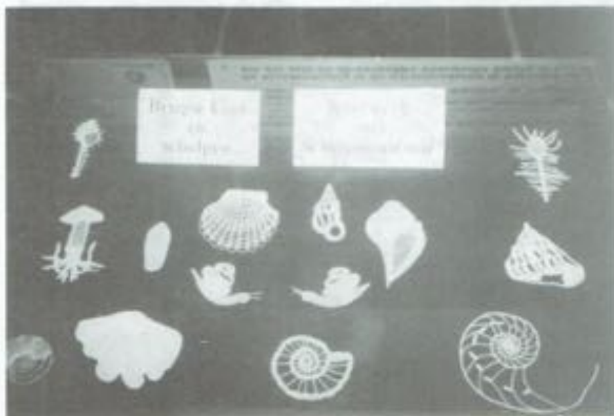
Gedeelte van de stand van Fernand Boone