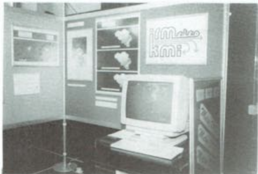
Stand van het K.M.I.