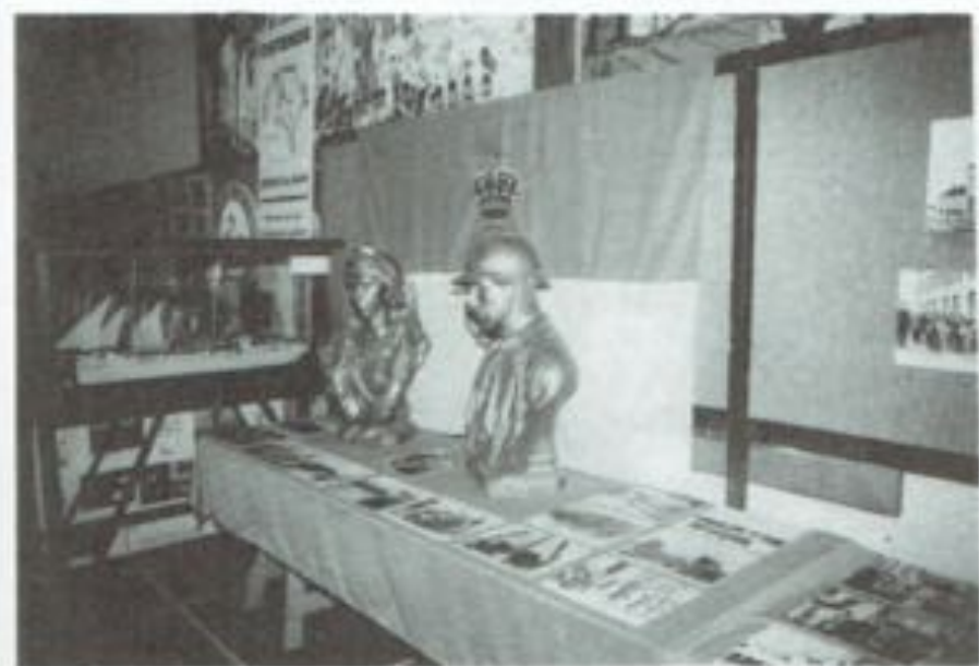
Stand van het Koninklijk Werk IBIS