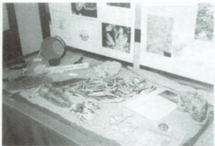
Stand van de Strandwerkgroep