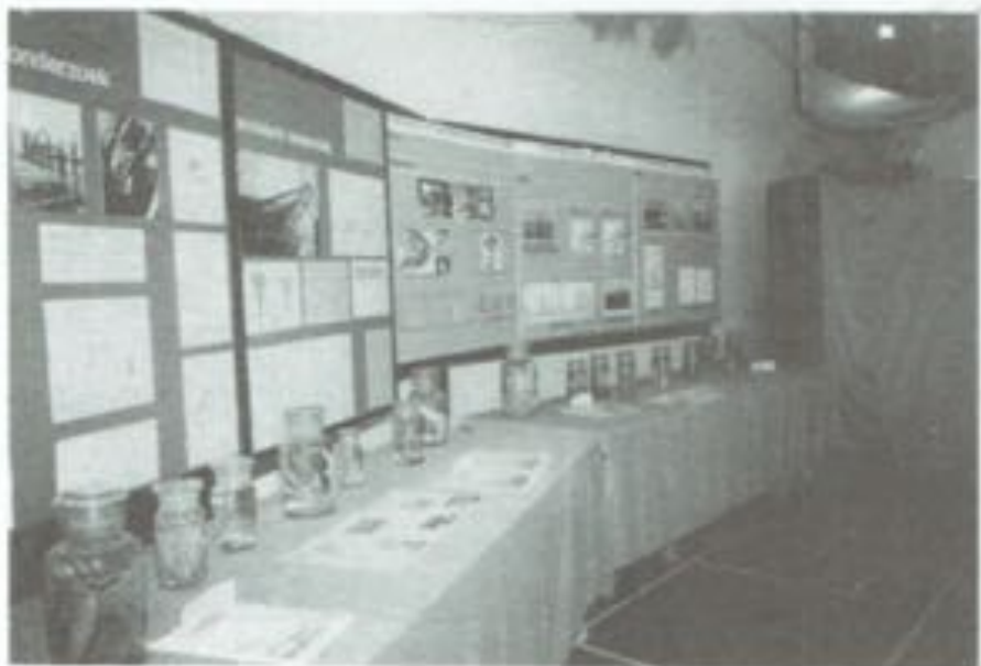
Stand van het Rijksstation voor Zeevisserij