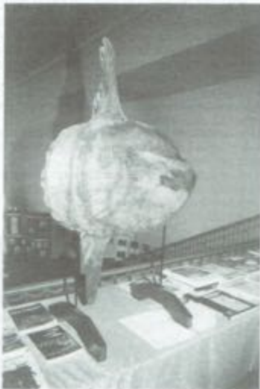
De maanvis als blikvanger op de tentoonstelling Zeesymfonie

Ons exemplaar werd in de jaren tachtig aangekocht door de heer Van Gheluwe in de vismijn van Oostende. Het ware natuurlijk interessant te weten waar en door welk schip die maanvis gevangen werd.