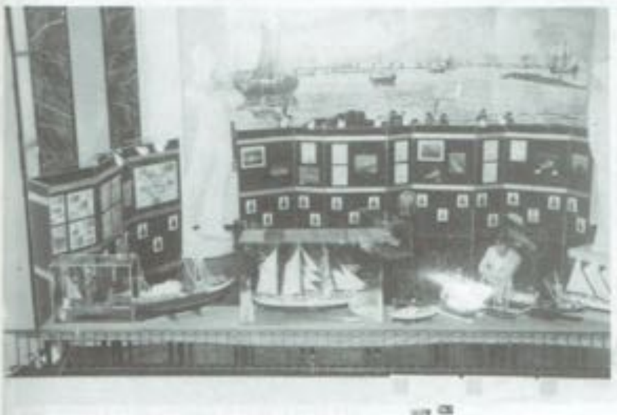
Stand van de Zeemacht en scheepsmodellen