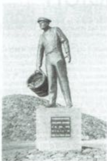
De mosselman op het havenhoofd te Yerseke

Wanneer de zomer de kleine mosselzadjes, die door de moeder-mossels in de zogenaamde "melktijd" (tussen maart en juni) zijn uitgeworpen, zich in dichte banken op de zeebodem hebben vastgezet, varen de mosselkwekers met hun vaartuigen uit om hierop te gaan vissen. Zaadval heeft plaats in de Waddenzee en de Zeeuwse wateren. De centra van waaruit deze visserij plaats heeft zijn Yerseke, Zierikzee, Bruinisse en Tholen in Zeeland, Harlingen (Friesland en Den Oever (Noord-Holland). Op speciale plaatsen in deze wateren wordt het mosselzaad in dunne lagen uitgezaaid. Deze speciale watergebieden zijn in vakken ingedeeld (percelen). Het op de percelen uitgezaaide mosselzaad kan hier opgroeien tot zogenaamde "halfwas". Het gaat dan "spinnen" dat wil zeggen het vormt een samenhangend geheel over de zeebodem.