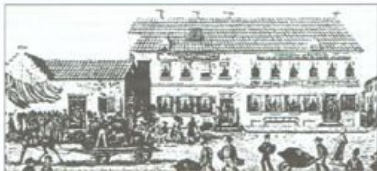
1815 - De Visserskaal te Oostende met Waterloo- hotel.