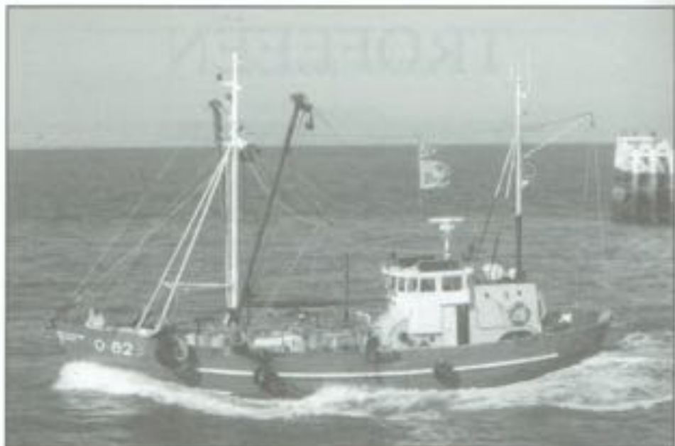
Trofee 1994 «De Gouden Vis» voor de O.62 DINI