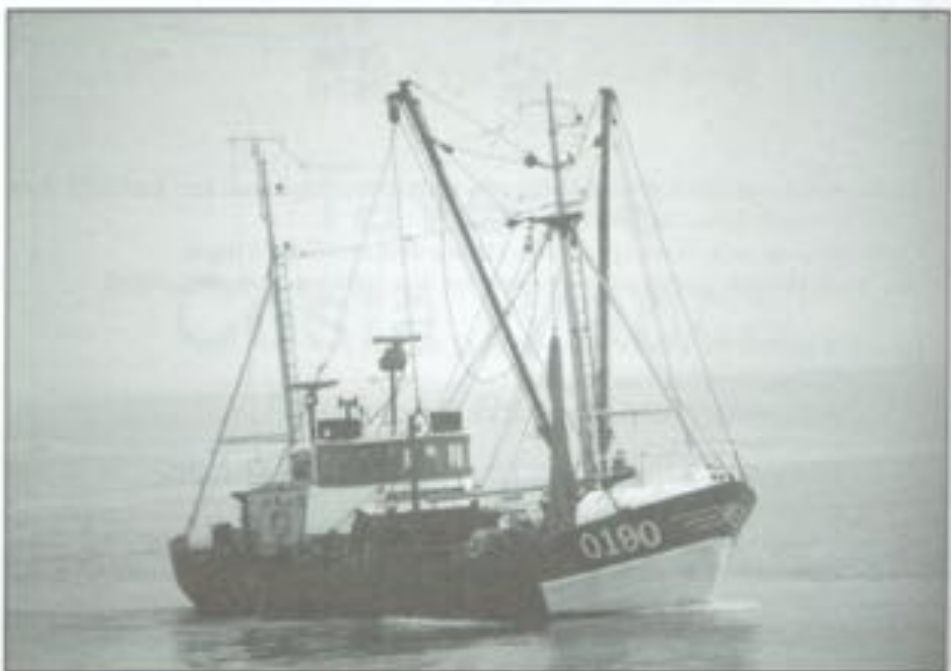
Trofee 1994 «De Zilveren Vis» voor de O.190 RENILDE.