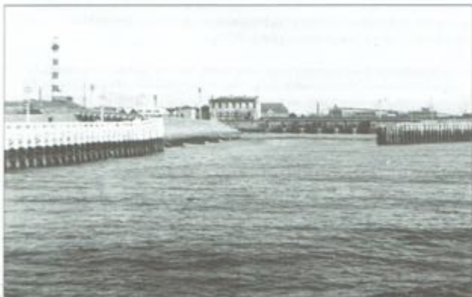
1936 - In het midden het mariene labo te Oostende, vernietigd gedurende de oorlog (1940-1944)

Nu volgt een passus die, bij gebrek aan nu niet meer te achterhalen achtergronds-