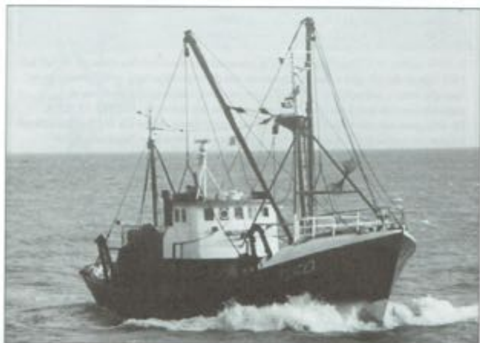
TROFEE DE ZILVEREN VIS 1995 VOOR DE O.427 «MARJON»