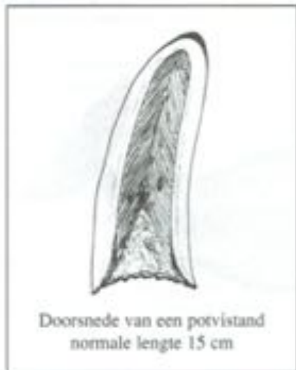
Doorsnede van een potvistand normale lengte 15 cm

Om de ouderdom vast te stellen werden 2 tot 4 tanden uit het onderste kaakbeen verwijderd (bovenste kaakbeen bevat geen tanden, maar wel uitsparingen waarin de tanden passen), deze tanden werden naar de universiteit van Cambridge doorgestuurd. Tot op heden is de leeftijd van de potvissen niet gekend. De ouderdom wordt vastgesteld door de opeenvolgende lagen dentine te tellen, of één jaar eenstemt met 1 of 2 jaarringen weet men niet zeker.