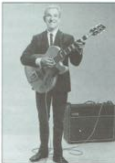
Zo zagen we hem destijds vaak op de televisie