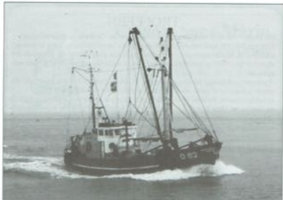
TROFEE DE GOUDEN VIS 1995 VOOR DE O.62 «DINI»