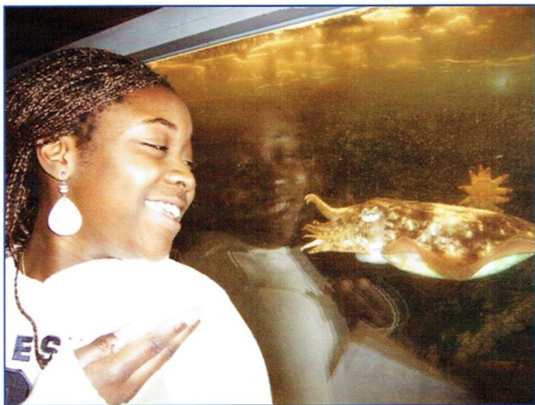
Magnolia, leerlinge O.L.V.O. lonkt naar een zeekat of is het de zeekat die naar het meisje lonkt ?