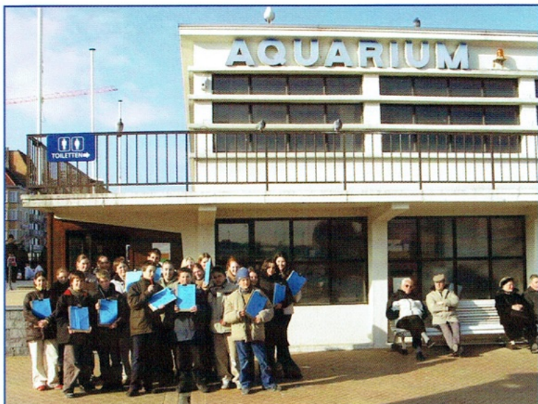
Vissenproject 22 februari 2005