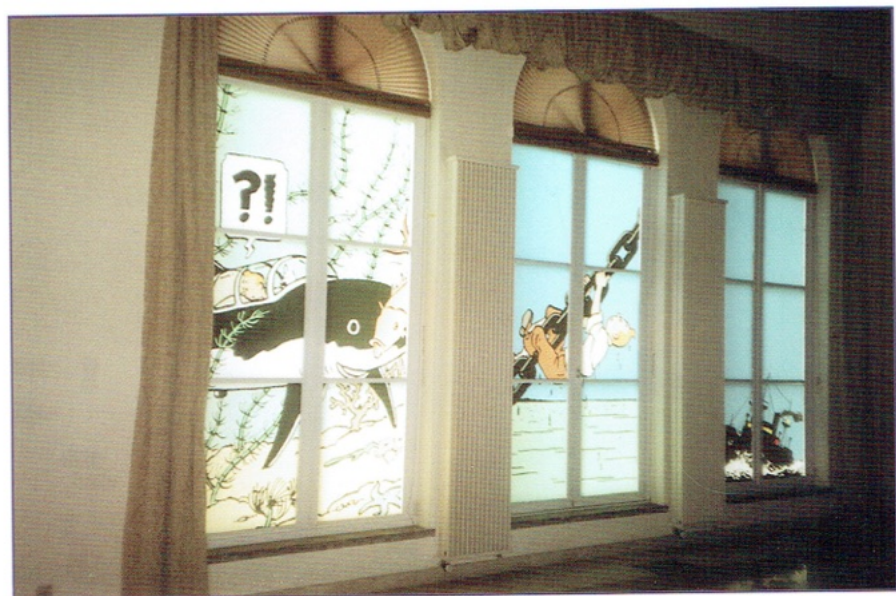
Raamdecoratie in de tentoonstelling.