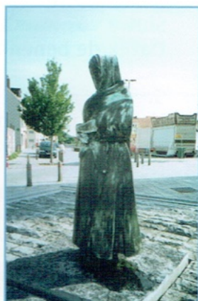
Standbeeld van een vissersvrouw op het plein voor de st.-Antoniuskerk, Vuurtorenwijk Oostende. Ontwerp van Martine Labbeke.