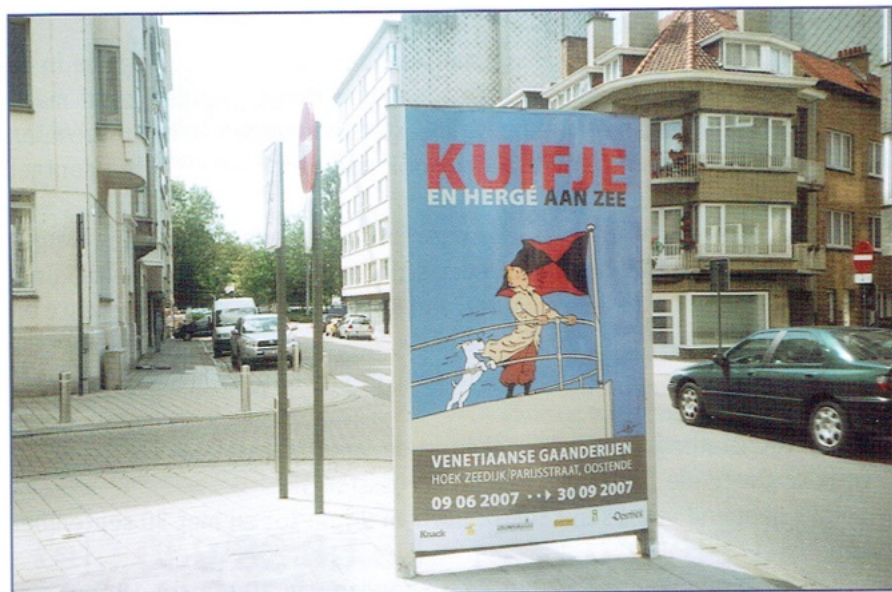
Reclamebord in de stad

Het album is te verkrijgen aan de balie in de tentoonstelling of ook nog in de Standaardboekhandel te Oostende Prijs: 11,50 euro.