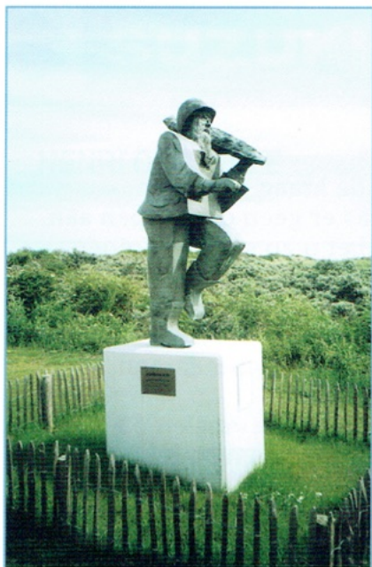
Zijzicht Mong Devos aan de strandtoegang van de Vosseslagwijk te De Haan