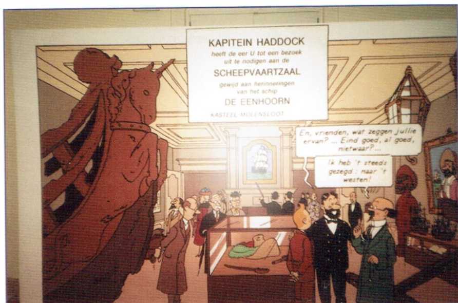
Grote muurfoto in de tentoonstelling.