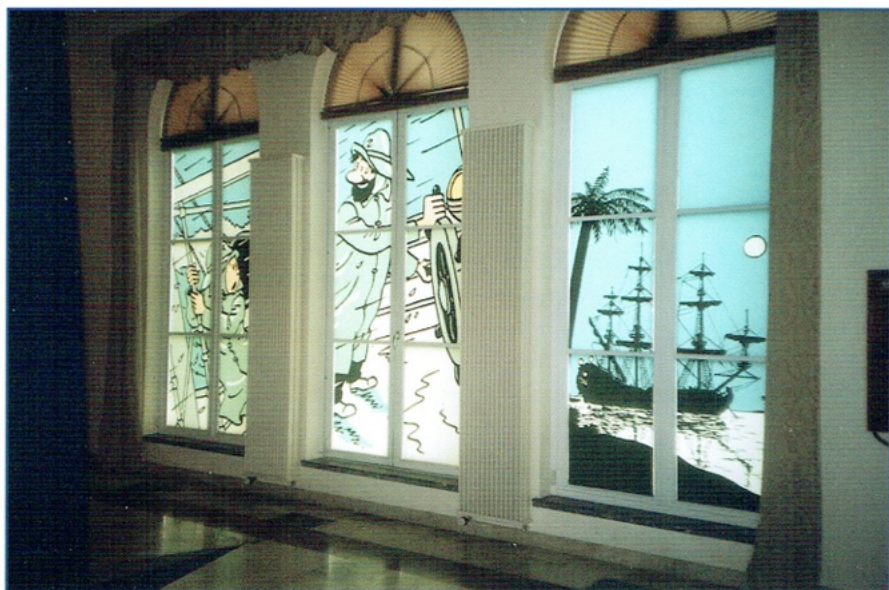
Raamdecoratie - Kuijfe en Kapitein Haddock op een woelige zee