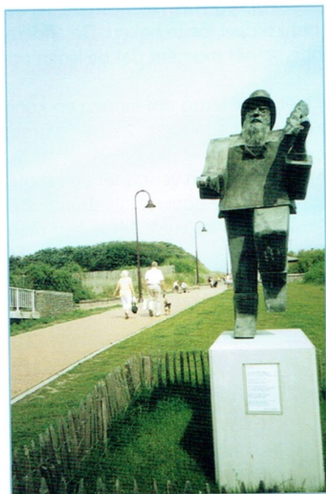
Zijzicht Mong Devos aan de strandtoegang van de Vosseslagwijk te De Haan

Later bleek dat Julle te diep in het water was geweest en verrast door stroming en een diepe kuil zichzelf had verdronken.