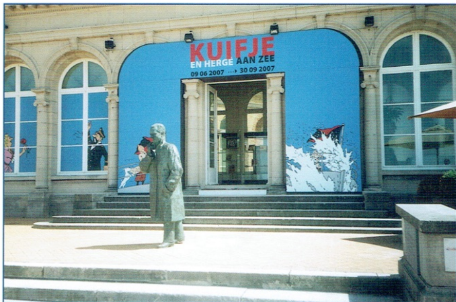
Toegang van de Tentoonstelling "Kuijfe en Hergé aan Zee" op de Zeedijk te Oostende. Vooraan het standbeeld van Koning Boudewijn.