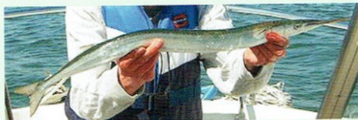
Sommige sportvissers zijn gespecialiseerd om geep te vangen

Vanwege de spitse snuit zegt men ook SIPPE, ook GROENGRAAT. En dichtertlijk: DE SPEER VAN NEPTUNUS.