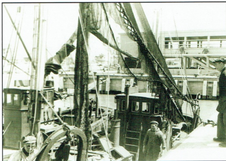
Vergis je niet. Dit is niet de renovatie van het aquarium maar wel de in opbouw zijnde garnaalmijn die later aquarium werd. [Foto genomen in 1958 - Archief van Eddy Eneman]

Driemaandelijks tijdschrift - 2 de trimester 2011 - nr. 84 Afgiftekantoor Oostende 1