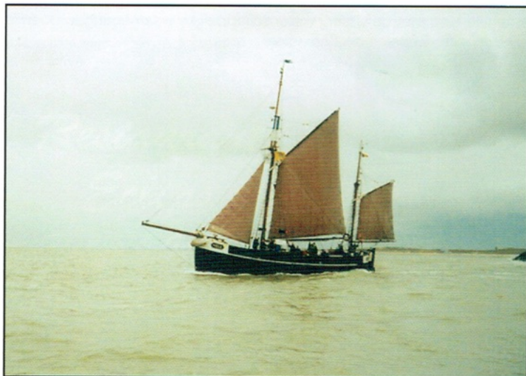
De Nele vaart uit de haven Oostende

Driemaandelijks tijdschrift - 1 ste trimester 2012 - nr. 87 Afgiftekantoor Oostende 1