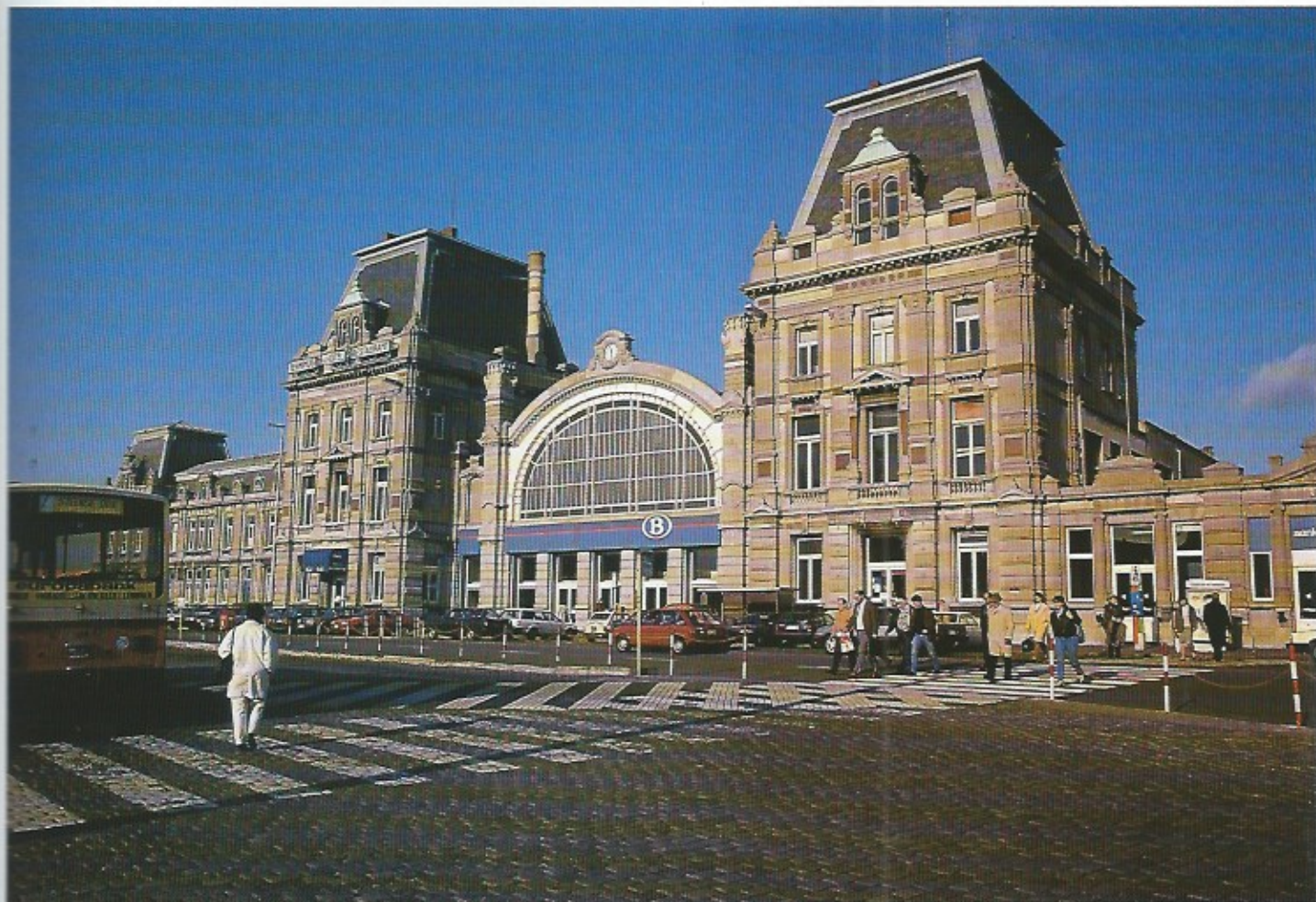
Het Stationsgebouw van Oostende werd ingehuldigd op 1 augustus 1913. Dit station met zowel maritieme als toeristische bestemming is een Belle-Epoquemument.

Voor deze 9de bijdrage over het Bouwkundig erfgoed van Oostende duikelen we weer even de tijd in.