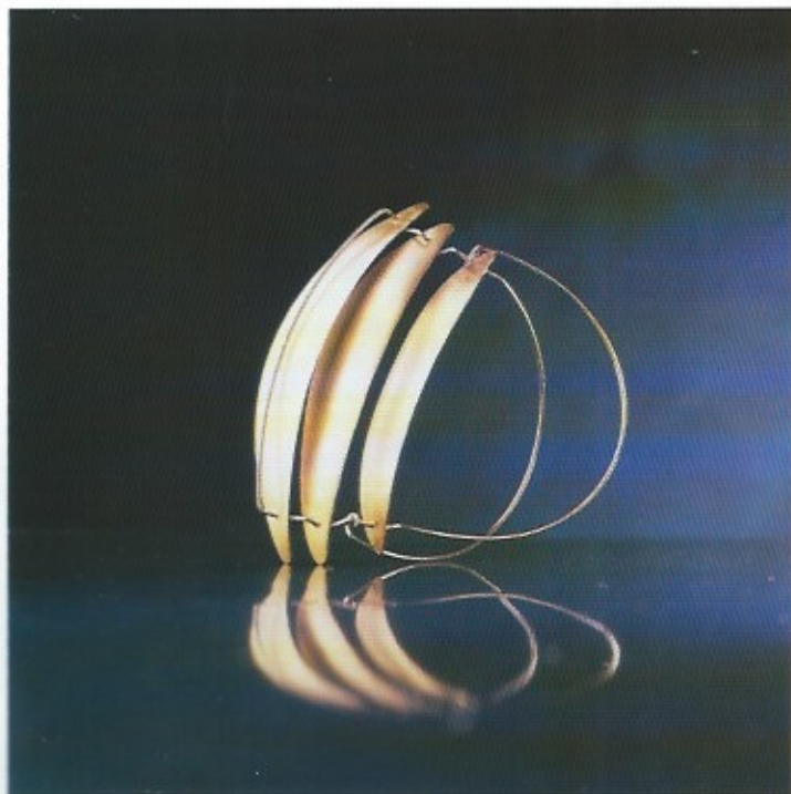
staal + goud 1993