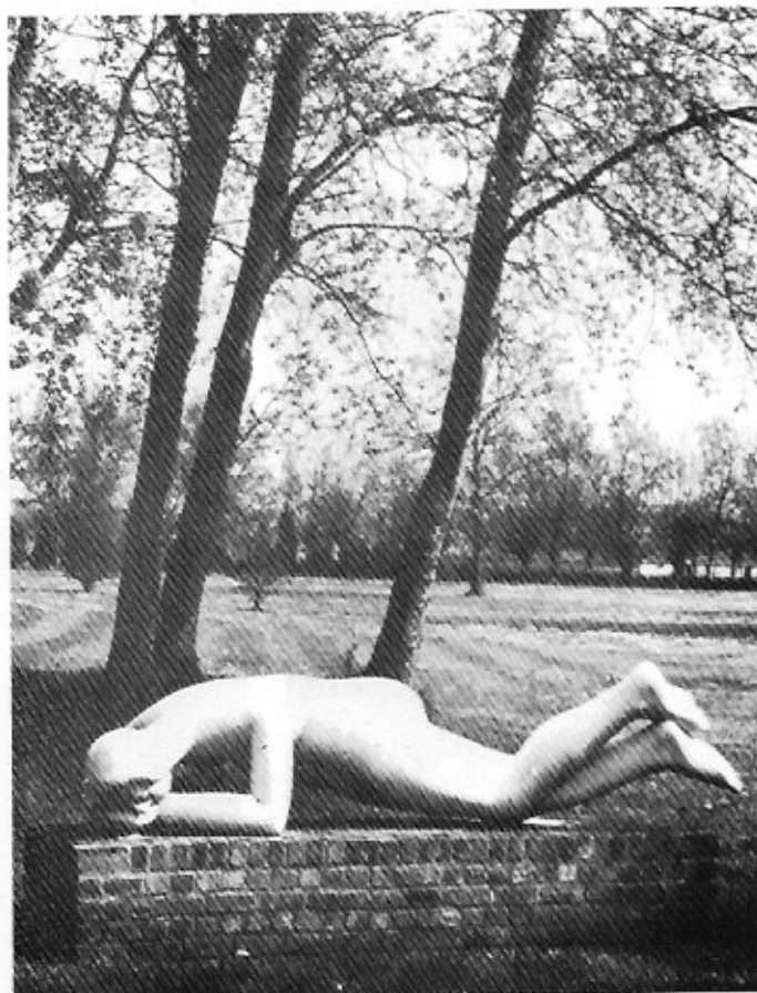
Constant Permeke: Niobe , 1946. Gegoten kunststeen, 75 × 271 × 108.

Hoewel Constant Permeke momenten van diepe levenswijshouding en ernst kent („... want wie is niet van laste moe?” 20.8.18), is hij vaak ten prooi aan psychologische hoogten en laagten. In een schrijven van 27.2.21 leest men: „'t Is overal op zijn beste” maar op 8.7.21 klinkt het anders: „'t Gaat niet! veel brol, te véél met de materielen kant van 't leven...” Anderzijds blaakt Permeke op sommige ogenblikken van zelfzekerheid. Hij stuurt een kandidaat-koep, een politicus „die nogal kluiten te verteren heeft” naar Sélection in Brussel: „brenge hem onder 't vuur van de rue des Colonies, hij zal smelten, dat zeg ik” (27.2.21). Ook zelfironie is hem niet vreemd. In verband met een gepland artikel door André De