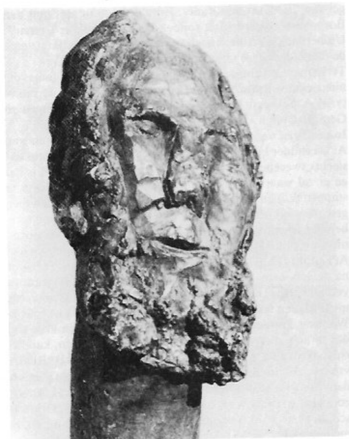
Constant Permeke: Christuskop , 1937. Gips, 52 x 26 x 13, get. r.o. Permeke.