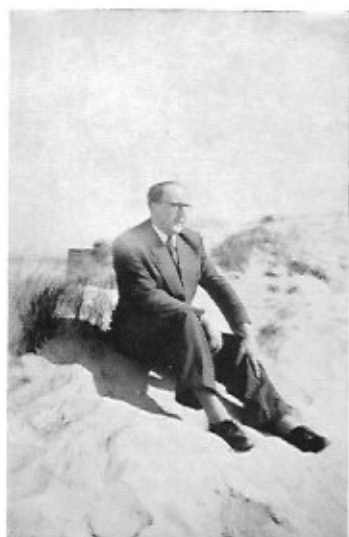
GASTON DURIBREUX (* Oostende 1903)

Met Zure Druiven dat reeds zijn tweede druk beleefde, wat eerder een zeldzaamheid is in de wereld van de Vlaamse literatuur, werd Duribreux opgenomen in de rij der schrijvers van groot formaat. Door een stevige constructie geleid is hij hier diep doorgedrongen in de conflicten van de menselijke ziel en belicht hij zeer scherp de problemen die