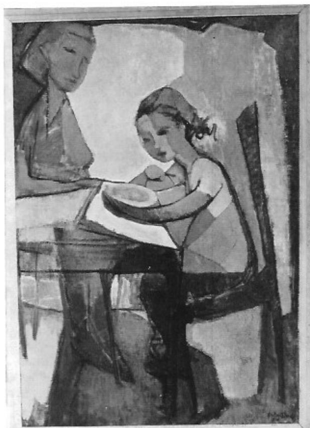
Anto Diez. Kinderen.

Net als een deur onweerstaanbaar openvliegt onder de druk van een rukwind, zo wordt ge opgevangen en meegevoerd door de orkaan-mens, Anto Diez. Indien het werk niet volstond om de Spaanse oorsprong te verraden dan zou ongetwijfeld het temperament van Diez hierover boekdelen spreken.