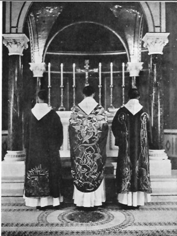
Gewaden St Andriesabdij, Groen. Ontwerp: Hr en Meer, Verboden-van Rie Uitvoering: A. E. Grossé, Brugge.

Er mag wel even aan herinnerd worden dat deze toepassingen niet behoren tot het eigen object van de kunst. Het is nochtans de kunst die ze mogelijk maakte, door het cultiveren van die eerste expressiviteit waardoor de verhouding van het kled tot het lichaam duidelijk werd gemaakt. Welk is nu die eerste verhouding? Wat betekent: een menselijk lichaam omkleden? Het komt er eigenlijk op aan een driedimensionaal lichaam, eerst als voorwerp beschouwd, te omhangen met een platte stof. Men kan dit op om het even welke manier doen, mits het li-