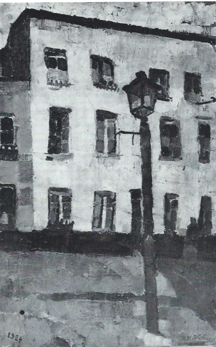
H.-V. Wolvens : De gaslantaarn (1924).