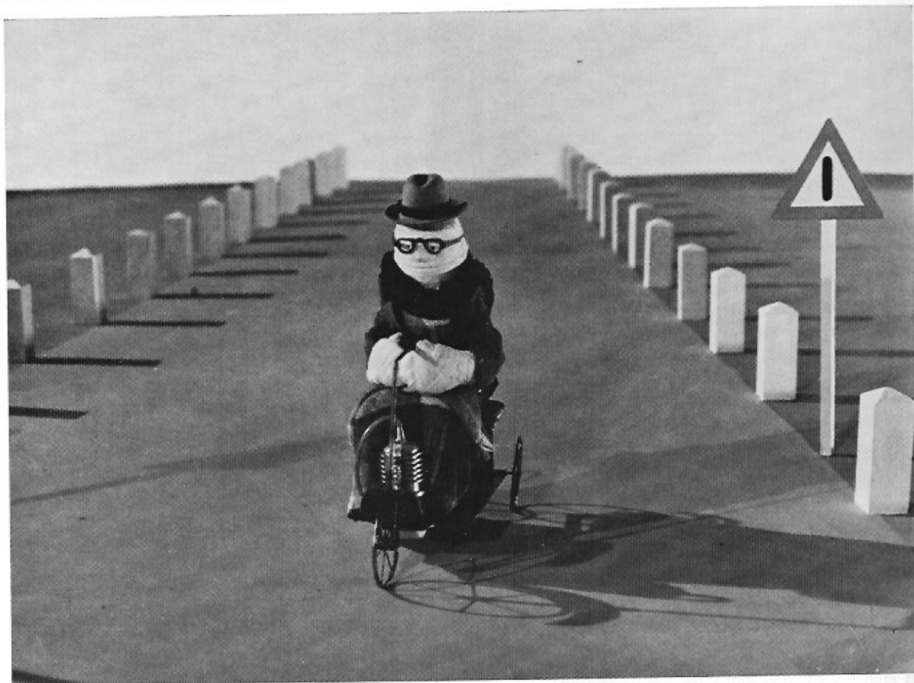
Beeld uit 'Snelheidshartstocht' van Jiri Trnka, een film over een raceman en wat hij moet laten voor zijn hobby.

Animatiefilm: een fascinerende wereld, met achter de schermen een nog veel meer fascinerende wereld. Alleen reeds het vervolgen van wat er zoal op de markt uitkomt, en daarbij vergelijken van wat er zoal gemaakt wordt, is een vergelijking waard. Toch is het bijna zeer moeilijk een goeie animatiefilm vast te krijgen. Eenmaal een of ander festival gepasseerd en al dan niet gelauwerd, bestaat er heel veel kans dat de film de kelder van het verhuurhuis niet meer verlaat, ook al spant bv. Progrèsfilms zich in om deze films in België te krijgen. Animatiefilm is nu eenmaal niet commercieel en 'een tekenfilmke zien' is nog teveel zich blind gapen op de verbluffende techniek van een Walt Disney, genieten van de schone kleurtjes en de lieve verhaaltjes van hondjes en katjes met happy ends, ofwel de Flinstones en de Jetsons aan het werk te zien. Ieder jaar presenteert het festival van Annecy hopen animatiefilms, en telkenjare groeit de belangstelling. Jammer genoeg zijn het nog teveel de kineasten zelf, enkele journalisten en de bewoners van Annecy die de films zien.