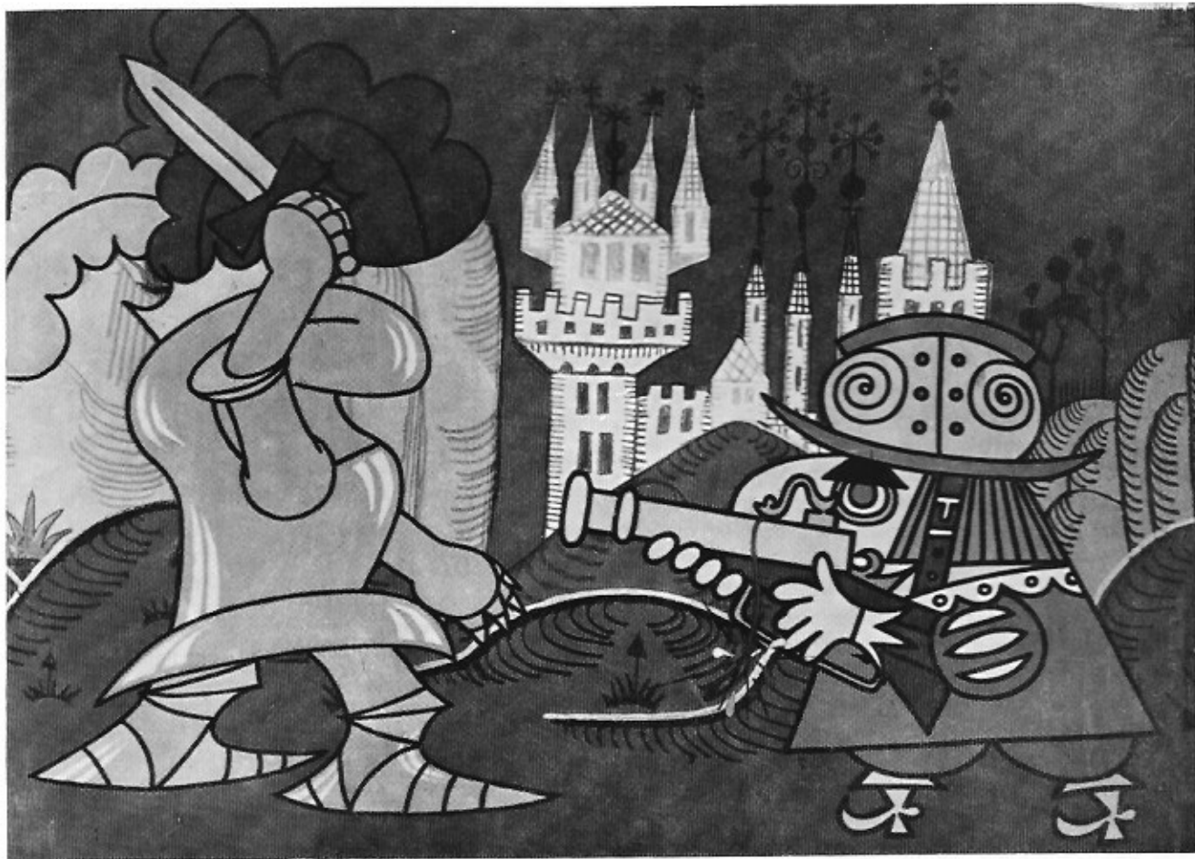
Beeld uit 'Wees op uw hoede!', de opmerkelijke film van Jiri Brdecka.

Western' en 'Rood en Zwart'. Uit zijn oeuvre zijn dat de twee meest bekende, en 'Rood en Zwart' behandelt het thema van de stierengevechten, of beter, het parodiseert de kijkmassa die de overwinnaar toejuicht en de verliezer uitjouwt, afgezien van zijn vroegere prestaties. Weliswaar een goede weergave van een massamentaliteit.