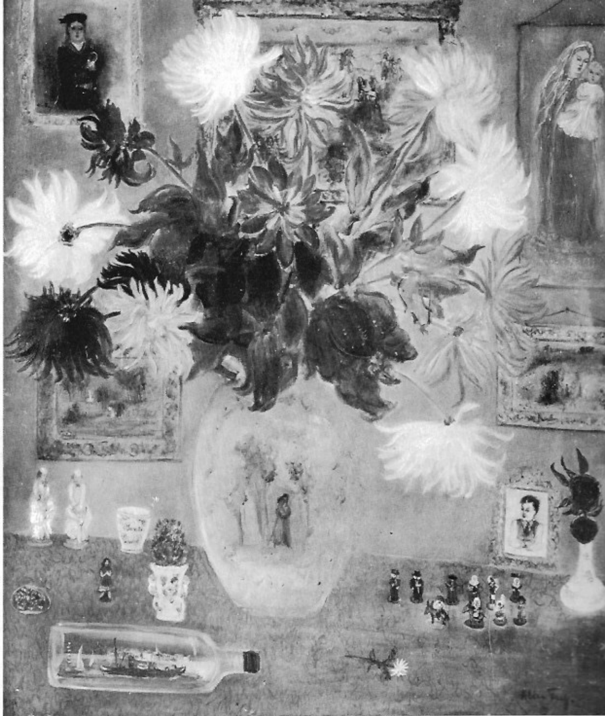
Alice Frey : Stilleven, 1940.