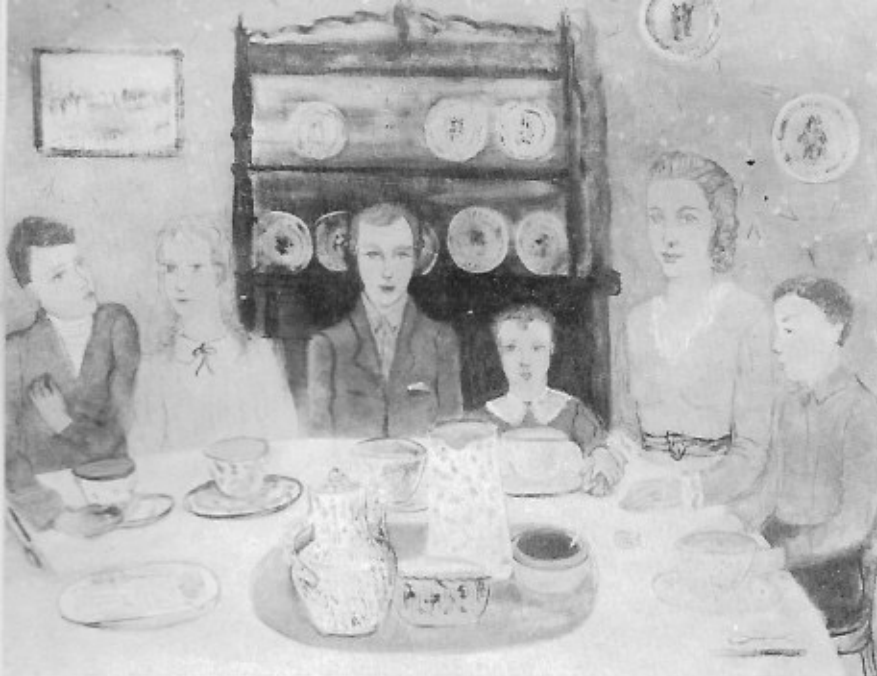
Alice Frey : Familiegeluk, 1936.

...Des thèmes qui, chez d'autres, seraient plein d'afféterie, de maniérisme, de nonchalance, revêtent sous son pinceau un air de fantaisie heureuse.