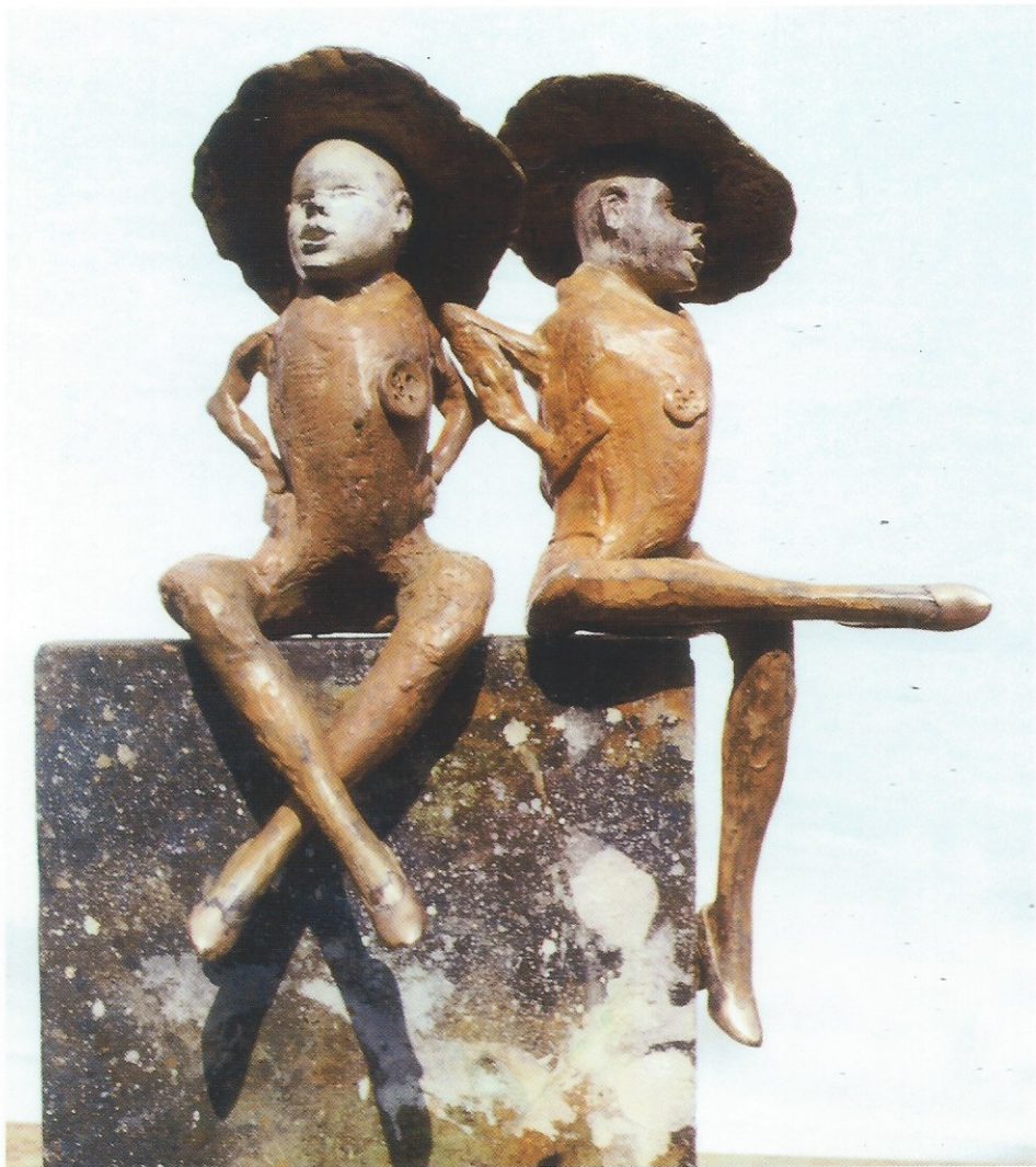
Les Cailles Bronze 1/1