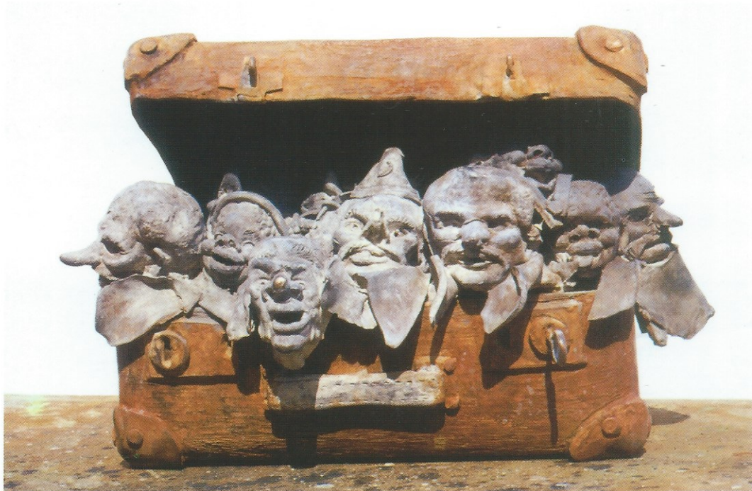
Le voyage Bronze 1/1