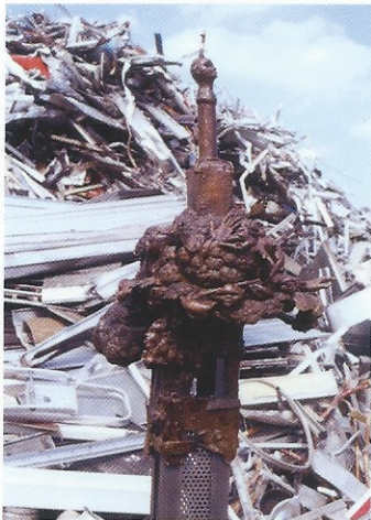
Ce n'était pas du cinéma Bronze 1/1

C'est la troisième fois que l'artiste-sculpteur Marcel Taton quitte son atelier de Horion-Hozémont pour exposer quelques-unes de ses sculptures en bronze à la Foire Art Expo qui se tient au Jacob Javits Center de New York. C'est là que, chaque année, des peintres et des sculpteurs issus de 650 galeries du monde entier viennent présenter leurs créations aux marchands d'art et aux amateurs.