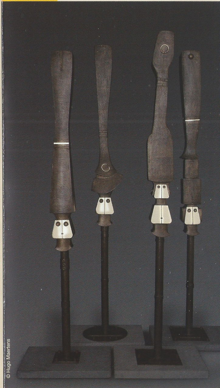
Zijn talrijke projecties verzamelen hij tot één geheel, 199

De expo wordt onderbouwd door een juweel van een monografie. Het boek verbindt oeuvre, levensloop en een onstilbaar verlangen naar exotische bewustzijnsverruiming tot een eenheid. Gouden verlangen heet het project dat Minnebo's carriëretentoonstelling en de onvergetelijke monografie omvat.