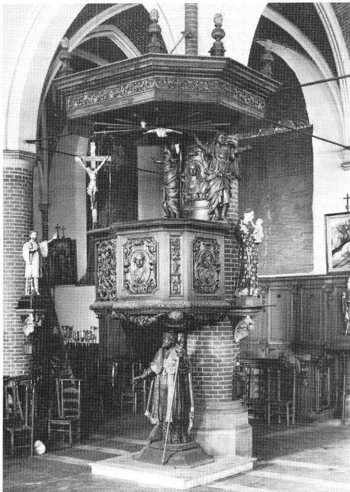
De kansel - St.-Rikierskerk / Bredene.