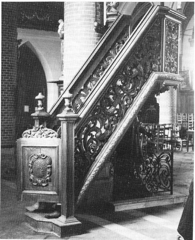
Trapleuning kansel - St.-Rikierskerk / Bredene.