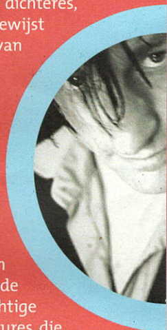
► RICK DE LEEUW