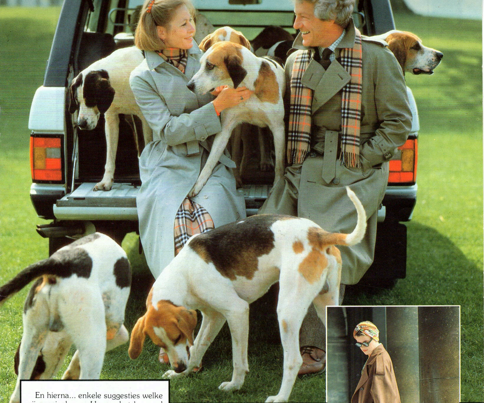
Burberrys of London

En hierna... enkele suggesties welke wij speciaal voor U voor het komend seizoen bij de TOP merken geselecteerd hebben.